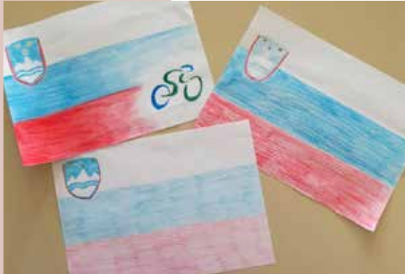
Zastavice za navijanje na kolesarski dirki.