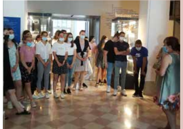
Delo v Muzeju novejšje zgodovine Slovenije.

Dijaki so z delom v muzeju izgrajevali, razširili in poglobljali znanja o najpomembnejših dogodkih, pojavih in procesih iz nacionalne zgodovine 20. stoletja in začetka 21. stoletja. Razvijali so spretnosti časovne in prostorske predstavljivosti. Obenem so ob razširjanju znanja o slovenski zgodovini in konkretnih eksponatih razvijali zavest o narodni identiteti in državni pripadnosti. Naučili so se opisati življenje Slovencev v samostojni državi z različnih perspektiv. Pojasnili so pomen mednarodnega povezovanja Slovenije. Z uporabo in učenjem ob raznovrstnih zgodovinskih virih so oblikovali svoje sklepe, mnenja, stališča in interpretacije. Pri različnih oblikah sodelovalnega učenja so razvijali tudi socialne spretnosti (Učni načrt, 2008).