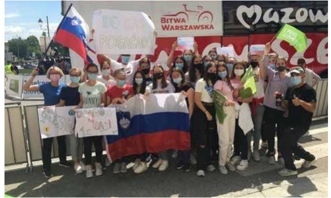
Na startu etape kolesarske dirke po Sloveniji, Brežice, 11. 6. 2020.