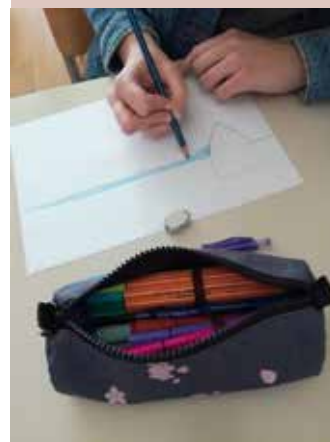
Delavnica risanja državnih simbolov.

Eden od pomembnih domoljubnih dejavnikov je, da dijaki poznajo državne simbole, razumejo njihov pomen in se z njimi identificirajo ter do njih vzpostavijo spoštljiv, pozitiven odnos. V ta namen smo na gimnaziji izkoristili start 3. etape kolesarske dirke po Sloveniji, ki je 11. 6. 2021 potekal v Brežicah. Preden so se dijaki podali na prizorišče, so v timski uri zgodovine in športne vzgoje spoznali državne simbole. Nato pa so v skupinskem delu zastavo in grb Republike Slovenije tudi risali. Poznavanje in navzočnost državnih simbolov krepi domovinsko zavest in zavedanje pripadnosti svoji državi. Obenem pa državni simboli prispevajo k povezovanju in vključevanju skupnosti.