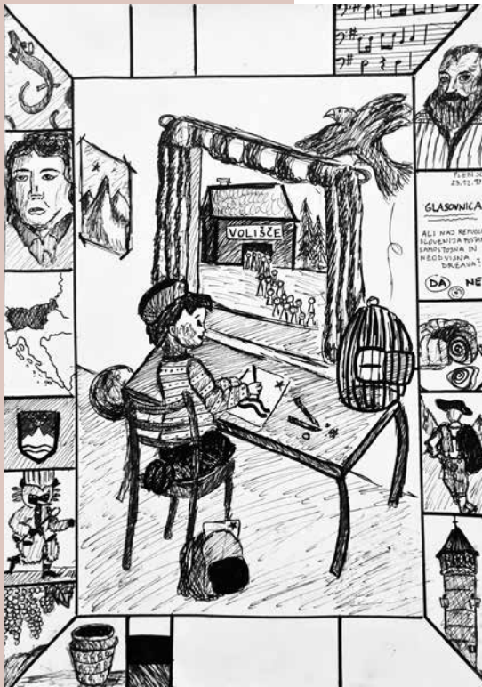
Izdelek dijakinje Hane Zorec.