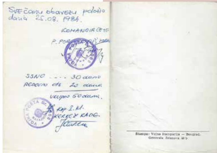
Datum opravljene zaprisege oz. t. i. 'zakletve' ter število dni dopusta