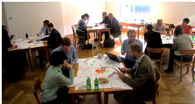
► Prvi posvetovalni obisk na UL TEOF

Z uporabo sodelovalnih metod (pri tem pristopu in širše) smo vplivali na odnos do spremljanja kakovosti. Na sestankih s članicami UL smo se soočili s precej odklonilnim