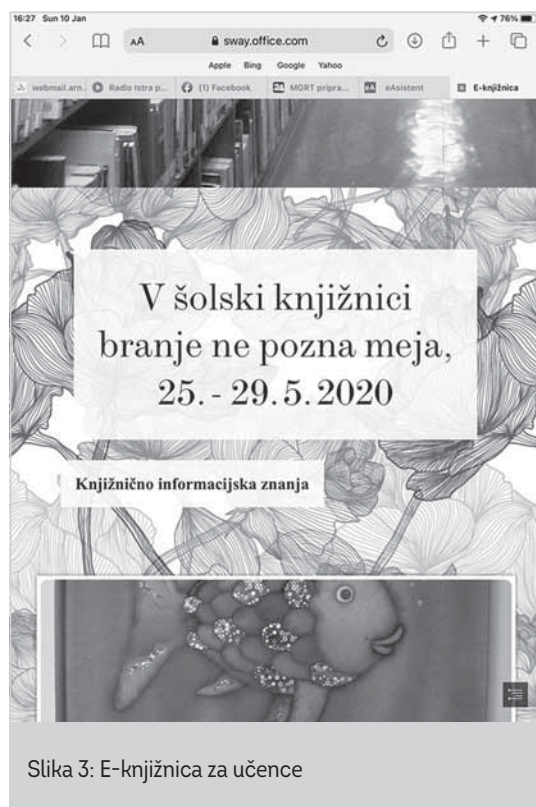
Slika 3: E-knjižnica za učence

Na začetku učenja na daljavo, marca, sem razmišljala, kako bi izpeljala pogovore za bralno značko. Najboljša rešitev mi je bila videti in slišati se v živo. Učencem sem predlagala aplikacijo Zoom in so se strinjali.