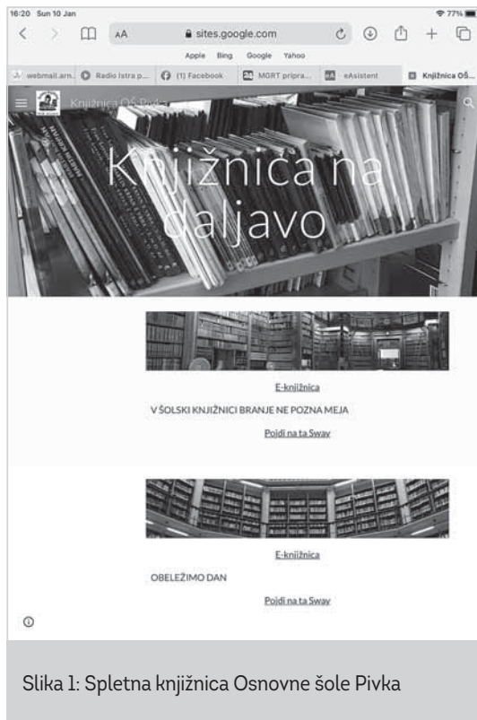
Slika 1: Spletna knjižnica Osnovne šole Pivka

Pomembno vlogo na strani sta imela tudi urnik in protokol izposoje ter vračanja knjižnega gradiva, saj so bili učenci tako sprotно obveščeni o poteku dela šolske knjižnice.