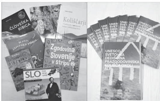
Slika 1: Knjižno gradivo

Želeli smo povezati učenje in spoznavanje osrednje tematike prek igre. Ko so vsi učenci