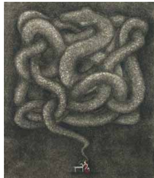
► SLIKA 4: S projektom avtorica približa Cankarjevo delo sodobnemu bralcu z enigmatično in likovno sugestivno ilustracijo. S klasičnimi (analognimi) tehnikami izrazi sodobni pogled na besedilo. Dora Kaštrun, Ilustracija besedila: Ivan Cankar, Bela krizantema . UL ALUO, Oddelek za oblikovanje, smer ilustracija, 2018.

Vsekakor je pred nami vsi zahtevna in odgovorna naloga, saj vizualno sporočanje prepleta našo družbo, oblikuje naše misli in naše delovanje. Verjetno bo v prihodnje uspešen posameznik (in družba) tisti, ki bo imel razvito kritično vizualno mišljenje, utemeljeno tudi na vizualni izobrazbi.