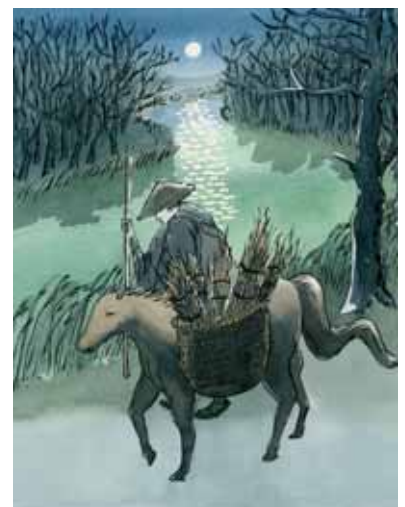
► SLIKA 5: V ilustracijah avtorica bralcu približa oddaljene svetove tako po času kot prostoru nastanka pravljič. To stori z natančno raziskavo japonskih lesorezov (ukijo-e) in poznavanjem evropskih likovnih oblikovnih načel ter vpeljejo lastne avtorske govorce. Sanja Zamuda, magistrsko delo, Japonske pravljičice . UL ALUO, Oddelek za oblikovanje, smer ilustracija, 2020.