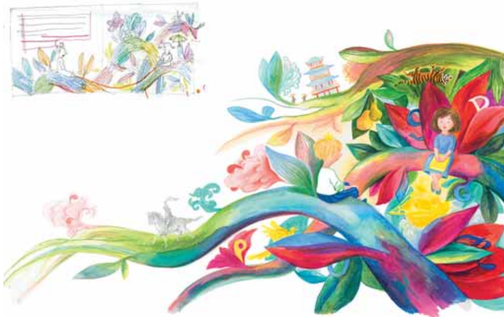
► SLIKA 3: Končna ilustracija je prešla več faz iskanja ustrezne likovne formulacije. Kompozicija, ki temelji na naraščajoči diagonali, daje občutek rasti. Z oblikami, barvnimi odnosi ter vizualnimi referencami in metaforami dopolnjuje besedno pripoved. Suzi Bricelj, Ilustracija iz slikanice O kraljeviču, ki ni maral brati . Mladinska knjiga, 2021.

V študijskem procesu raziskujemo delovanje ilustracije v različnih kontekstih, njene pripovedne zmožnosti in njene prepričevalne moči. Razumemo jo kot komunikacijsko obliko, ki pomaga pri razumevanju sveta, v katerem se posameznik nahaja, ter omogoča posredno srečanje z različnimi izkušnjami. Kakšna je kakovostna domišljajska ilustracija, h kateri stremimo na ALUO UL? Je podoba, ki prenese sporočilo gledalcu tako, da ga le-ta razume, ter mu omogoči nov pogled na obravnavano vsebino. V gledalcu vzpodbudi spoznavne procese, ki se sklenejo v obogateni intelektualni in čustveni izkušnji. Da to doseže, uporabi ilustrator sredstva likovnega jezika kreativno/inventivno, saj prav izvirnost v prikazu gledalca opremi z novo izkušnjo.