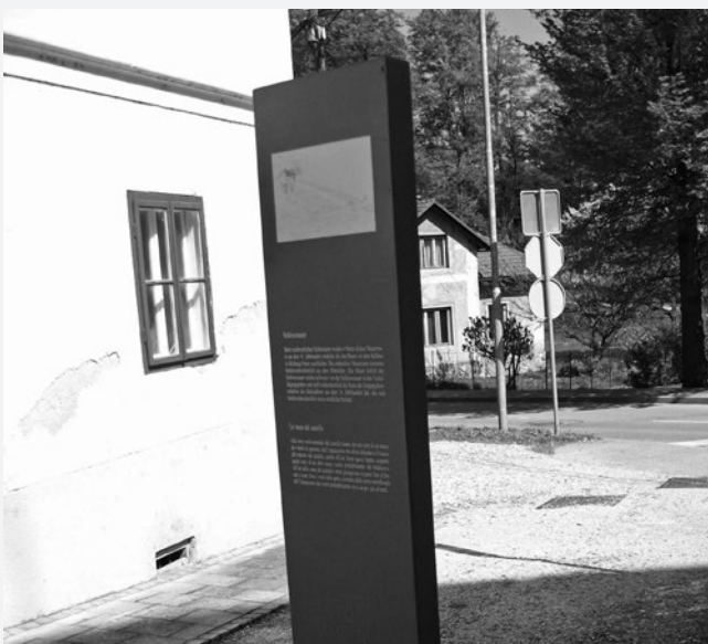
Informativna tabla pri gradu.

Pri gradu poišči informativno tablo, ki označuje južna mestna vrata. Tudi ta vrata označi na zemljevidu na str. 62 z X. (Ne pozabi na legendo.)