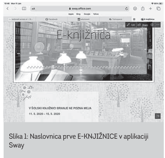
Slika 1: Naslovnica prve E-KNJIŽNICE v aplikaciji Sway

Kot vedno smo jih tudi tokrat povabile k prebiranju klasičnih knjig ali pa revij, ki jih imajo doma.