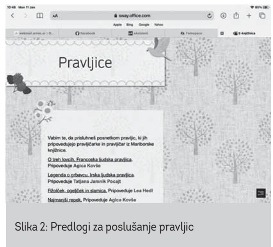
Slika 2: Predlogi za poslušanje pravljic