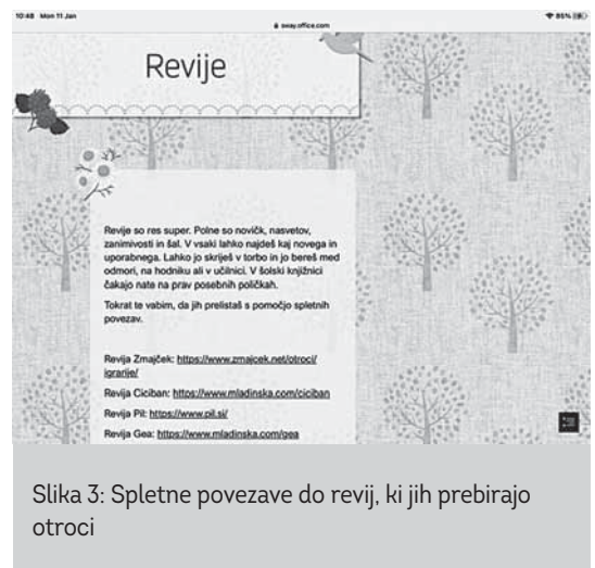
Slika 3: Spletne povezave do revij, ki jih prebirajo otroci