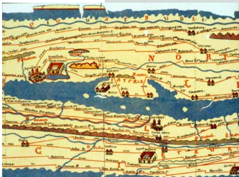
Slika 1: Del zemljevida rimskega sveta (t. i. Tabula Peutingeriana) z mesti in drugimi naselji ter cestnim omrežjem med njimi. Na prikazanem delu je v sredini, nad istrskim polotokom, zahodni del današnje Slovenije. (Preslikavo hrani Muzej in galerije mesta Ljubljane.)