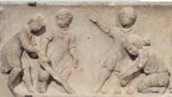
Slika 12: Igranje z žogo, upodobljeno na marmornem reliefu iz 2. stoletja.

Brez ali pa z zelo preprostimi igračkami se je možno igrati celo vrsto iger. Tako kot današnji so se tudi rimski otroci igrali zunaj, z vodo, blatom, kamenčki in palicami, se lovili in skrivali.