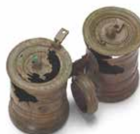
Slika 17: Bronasti črnilnik za rdeče in črno črnilo. Obe posodici imata tudi pokrovčka. (Foto: Matevž Paternoster, hrani: Muzej in galerije mesta Ljubljane.)