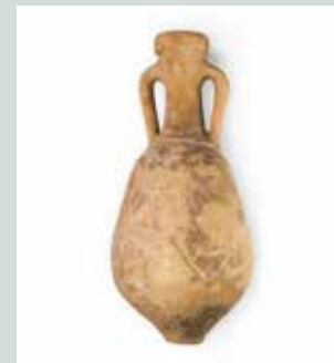
Slika 9: Amfora iz Emone. V takšnih amforah so po imperiju prevažali olivno olje iz Istre in severne Italije. (Foto: Matevž Paternoster, hrani: Muzej in galerije mesta Ljubljane.)

Na amforah je bilo pogosto napisano, kaj vsebujejo, ali pa je bil nanje vtisnjen žig proizvajalca.