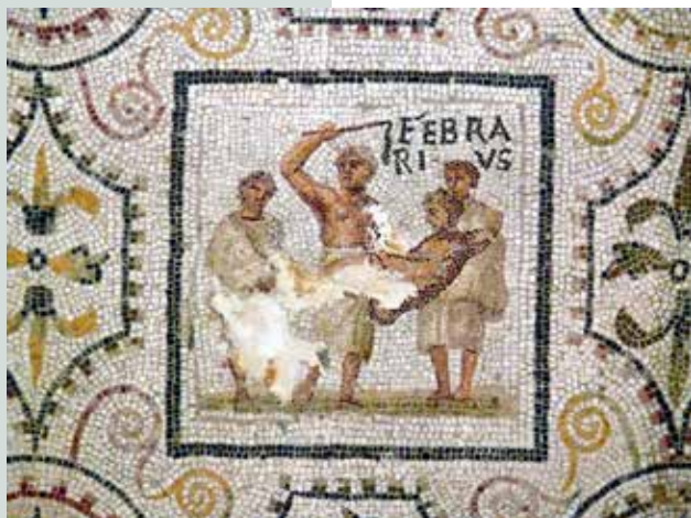
Slika 3: Mesec februar na koledarskem mozaiku iz Sousse (Tunizija) prikazuje obredno tepežkanje ob luperkalijah.

S širjenjem in legalizacijo krščanstva v 3.in 4. stoletju so se uveljavili krščanski prazniki. Število kristjanov v imperiju je skozi stoletja hitro naraščalo. Ocenjujejo, da jih je bilo leta 100 7500, leta 250 več kot milijon, leta 350 pa že 34 milijonov (nove demografske študije ocenjujejo, da je imel rimski imperij na svojem vrhuncu od 70 do 100 milijonov prebivalcev). Stari poganski prazniki so le počasi zamirali, nekateri pa so se samo odeli v novo, z novo religijo skladno podobo. Na primer, v opisih običajev pri saturnalijah lahko prepoznamo nekatere naše božične navade.