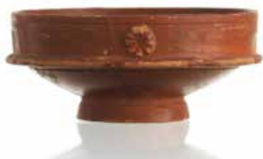
Slika 6: Posodica za omako. Podobne posode za serviranje in uživanje hrane, s svetlečim rdečim premazom, so bile nekaj časa zelo priljubljene. Zaradi povpraševanja so se razvili veliki proizvodni centri v severni Italiji in Galiji.