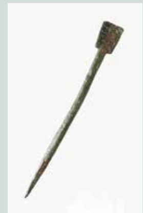
Slika 16: Bronasti stilus – na eni strani prirosten za pisanje na leseno tablico, prelito s čebeljim voskom, na drugi strani sploščen v lopatko, s katero je bilo moč napisano pobrisati.

Žerjal, T. (2012). Keramična lanterna ali »svetleča hiška« iz Školaric pri Spodnjih Škofijah. V: Emona med Akvilejo in Panonijo (Lazar, I. in Županek, B. (ur.)). Koper: Univerza na Primorskem, Univerzitetna založba Annales, str. 245–251.