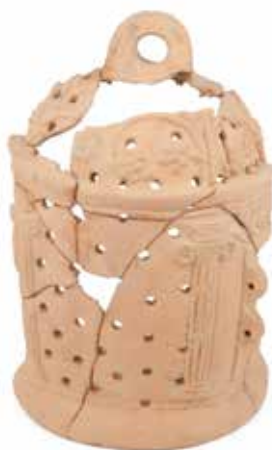
Slika 8: Keramični nosilec za oljenko – lanterna v obliki hiške iz rimske vile Školarice pri Spodnjih Škofijah. (Foto: Arhej d. o. o., hrani: Pokrajinski muzej Koper, inv. št. 20143, stalna razstava Od amfore do žare .)

Največ rimskih oljenk na današnjem slovenskem ozemlju je bilo odkritih v grobovih (predvsem Emone in Poetovione ter podeželskih grobišč na Dolenjskem), kamor so jih prilagali kot darilo pokojniku oz. svetilo tudi v zagrobnem življenju.