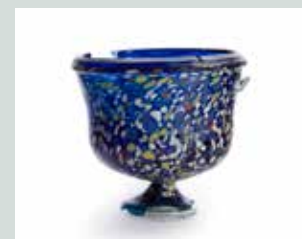
Slika 11: Med steklenimi posodami, izdelanimi s pihanjem v kalup, najbolj izstopajo posode iz mozaičnega stekla. Posoda na sliki nosi raznobarni cvetni vzorec, ki mu včasih rečejo »millefiori«.

Vsem otrokom, revnim in bogatim, pa je bilo skupno igranje z različnimi igračami ali brez njih.