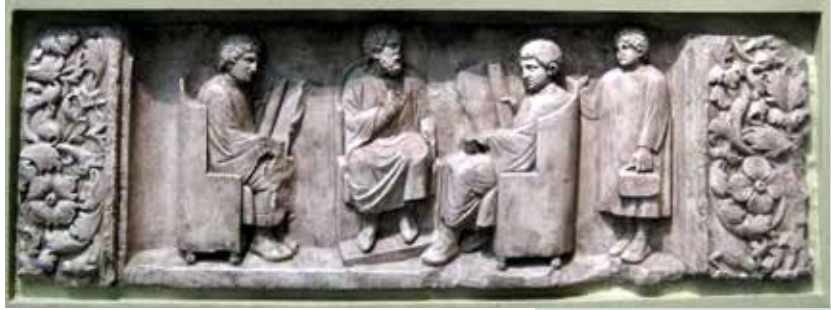
Slika 15: Učitelj s tremi učenci na nagrobnem reliefu iz Neumagna (Trier, Nemčija). Upodobitev je nastala okoli leta 180.

Verjetno največji prispevek rimske šole v našem prostoru je pismenost. Medtem ko je danes na svetu pismenih 86,3 % ljudi, starih več kot 15 let, strokovnjaki ocenjujejo, da je bilo v rimskem času pismenih med 10 in 15 % odraslih. Verjetno je bilo toliko tistih, ki so znali brati, in manj tistih, ki so znali tudi pisati. Pismenost je bila v glavnem razširjena v mestih; na podeželju je bilo pismenih malo. Najbrž je bilo veliko branja na glas in velika večina ljudi je literarna dela spoznavalo tako, da jim jih je nekdo bral. Dokumente, pisma in kopije literarnih in javnih besedil so pripravljali pisarji (slika 17). Nekateri od teh so delali v privatnih gospodinjstvih, drugi pa so delali za prodajalce knjig, v javnih pisarnah ali pa na trgu.