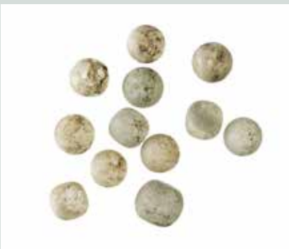
Slika 13: Steklene frnikole iz Emone.

Bolj kompleksne igrače so bile lesene ali keramične živali na kolescih, privezane na vrstico, ki jih je bilo moč vleči za sabo. Najbolj drage igrače – in zelo redko ohranjene – so bile gotovo lutke iz slonovine, s pregibajočimi se večjimi sklepi (slika 14). Dosti cenejše lutke je lahko skoraj vsaka rimska mama sešila iz ostankov blaga. Tako kot odrasli so tudi otroci uživali pri namiznih igrah, od katerih je bila ena podobna današnjemu mlinu. Seveda so imeli tudi domače živali, psi so bili še posebej priljubljeni.