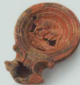
Podrobni opis glejte pri sliki 7.

Vsakdan se je za prebivalce mest, enako kot za tiste na podeželju, začel ob zori. Po umivanju in oblačenju je sledilo žrtvovanje bogovom v malem domačem svetišču, larariju. Potem je podeželan delal na poljih, prebivalec mesta pa je najprej sprejemal formalne obiske klientov, od njega odvisnih ali povezanih mož, doma, potem pa odšel na forum. Osrednji trgi so bili namreč glavna vozlišča dogajanja v rimskih mestih. Tam so slišali cesarske razglase, poslušali govornike, se udeležili sej mestnega sveta, razprav sodišča, poslovnih pogovorov ter raznih praznovanj in ceremonij. Nasploh