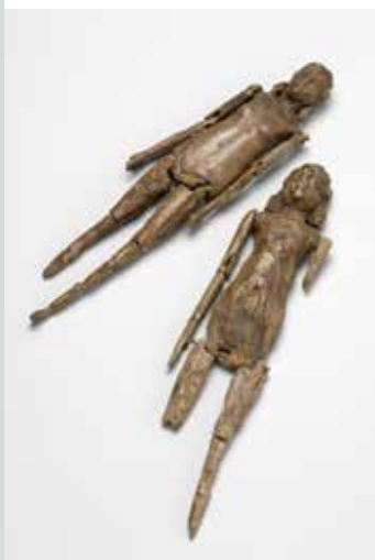
Slika 14: Slonokoščeni lutki iz groba deklice, odkritega na vzhodnem emonskem pokopališču. Igrači sta bili izdelani v 3. stoletju. (Foto: Tomaž Lauko, hrani: Narodni muzej Slovenije.)

Medtem ko je bilo v zgodnjih dneh rimske države izobraževanje povsem neformalno in je teklo v krogu (razširjene) družine, se je kasneje uveljavil sistem poučevanja proti plačilu šolnin. Rimski sistem izobraževanja je temeljil na grškem in mnogi od privatnih učiteljev so bili grški sužnji ali osvobodenci. Način učenja, ki se je uveljavil v Rimu, se je kasneje razširil po provincah. Učili so se tako fantje kot dekleta, čeprav ne nujno skupaj. Javnih, široko dostopnih šol brez plačila šolnin, kot jih poznamo danes, pa skoraj ni bilo. Prav tako ni bilo nobene s strani države uveljavljene obveze; o šolanju otroka je, tako kot o vseh drugih stvareh v otrokovem življenju, odločal njegov oče, pater familias . Sčasoma je postalo vsesplošno pričakovano, da bo oče dal svoje otroke šolati vsaj do neke mere, in za vsakega Rimljana, ki je želel vstopiti v javno in politično življenje, je bila izobrazba nujna.