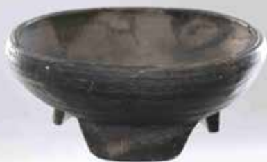
Slika 5: Trinožnik je keramična posoda za kuhanje na treh nogah, ki so jo postavili neposredno v ognjišče.