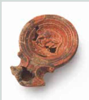
Slika 7: Oljenka z upodobitvijo Romula in volkulje (in Rema?). Številne oljenke so nosile podobe, bodisi iz mitoloških zgodb in junakov, prizorov lova ali ljubimcev v postelji in podobno.