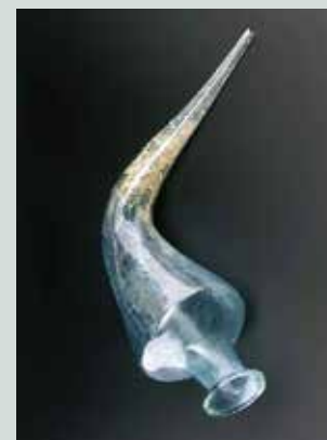
Slika 10: Stekleni rog za pitje vina. Izlizek je bilo treba ob natakanju zamašiti s prstom, potem pa: »Bene tibi!« (Na zdravje!).

Prosto pihanje stekla je v razvoju rimske steklarske obrti pomenilo pravo revolucijo, saj je omogočilo v kratkem času napihati večje število skoraj enakih posod in izdelavo številnih novih oblik. Kmalu je stekleno posodje postalo splošno razširjeno in cenovno dostopno. Uporabniki so kmalu ugotovili, da ima stekleno posodje številne prednosti: steklene posode se ne navzamejo vonja, lahko jih uporabiš za različne vrste tekočin ipd. Bolj razkošne posode posebnih oblik ali izdelave pa so bile še vedno drage in redke posode (slika 10, slika 11).