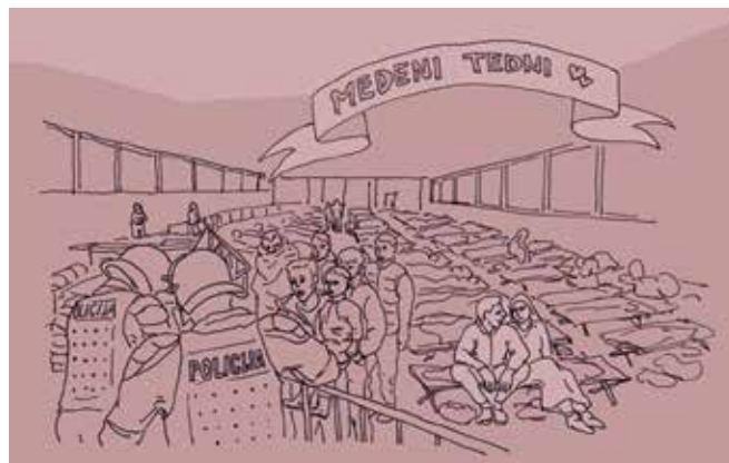
► SLIKA 3: Vesna Bukovec: Medeni tedni

Tretje izmed orodij, ki smo jih uporabili pri svojem delu, je orodje za analizo likovnih del (Slika 4). Orodje je bilo zasnovano na temelju izhodišč, podanih v priložniku (Holcar Brunauer idr., 2016). Orodje izhaja iz metode raziskovanja likovnih del (prim. Schulman Herz, 2010) in je naravnano tako, da spodbuja interakcijo učenca z likovnim delom. Z njim lahko učenci spoznavajo povsem neznano likovno delo kot tudi delo, ki ga že poznajo. Orodje učence spodbuja, da si ob delu zastavijo vprašanja, predvidevajo vsebino ter se opredeljujejo do likovnega dela, ki je pred njimi. Orodje smo vključevali na začetku učnega sklopa, kjer so učenci likovno problematiko šele spoznavali. Ob uvodu likovne naloge (Globoki tisk) smo si v razredu ogledali likovno delo Vesne Bukovec z naslovom Medeni tedni (Slika 3).