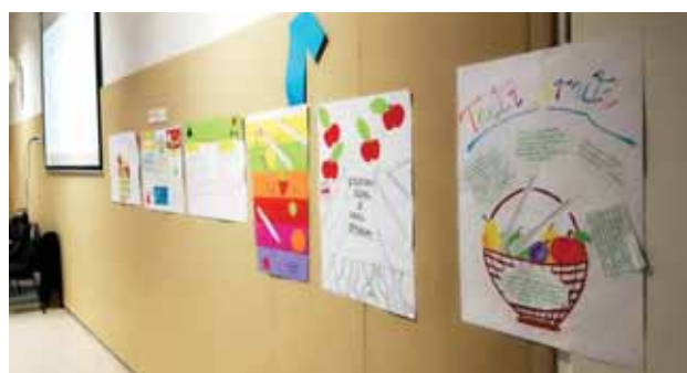
Slika 5: Ustvarjalni plakati, nastali na aktivih