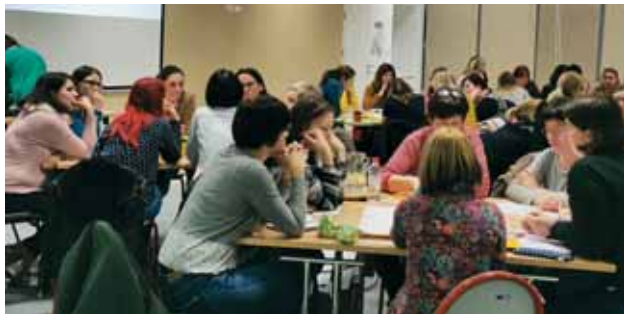
Slika 4: Aktivni po starostnih obdobjih za vse strokovne delavce

Na vzgojiteljskem zboru, ki je sledil kmalu za tem, smo pripravili razstavo vseh izvirnih plakatov, ki so nastali na aktivih. Pri predstavitvi svojih razprav v manjših skupinah so vzgojitelji opozorili tudi na možne izboljšave znotraj urnika in organizacije kuhinje ter zelenih pripomočkov, zato je po aktivu sledil tudi pogovor ravnateljice z organizatorjem prehrane v vrtcu (slika 5).