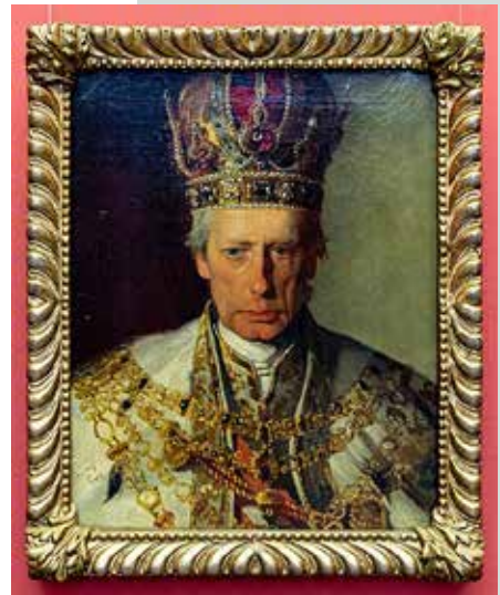
Cesar Franc I. (1768–1835). (Naslikal: Friedrich von Amerling, hrani: Alte Nationalgalerie, Berlin.)

Po sprejetju ključnih sklepov kongresa, torej da se s silo zatre upor v Kraljestvu obeh Sicilij in da se ne podpre revolucije na območju Grčije, Vlaške in Moldavije, se je sklenilo kongresno dogajanje v Ljubljani. Medtem ko je car Aleksander Ljubljano zapustil že 13. maja in se prek Budimpešte in Varšave vrnil v Sankt Peterburg, je cesar Franc I. v kranjski prestolnici ostal do 21. maja. Tedaj je s soprogo zapustil Ljubljano in se prek Celovca 24. maja vrnil v Schönbrunn. Metternich, glavni arhitekt ponapoleonske Evrope in ideolog ljubljanskega kongresa, je kot zadnji zapustil Ljubljano dan za cesarjem. Ob vrnitvi na Dunaj pa ga je že čakalo cesarsko imenovanje za avstrijskega kanclerja (Pivec - Stele, 1971, str. 208–209; Antoličič, 2021, str. 94).