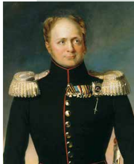
Car Aleksander I. (1777–1825). (Naslikal: George Dawe, hrani: Royal Collection Trust, London.)