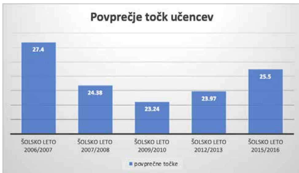
Povprečje točk učencev