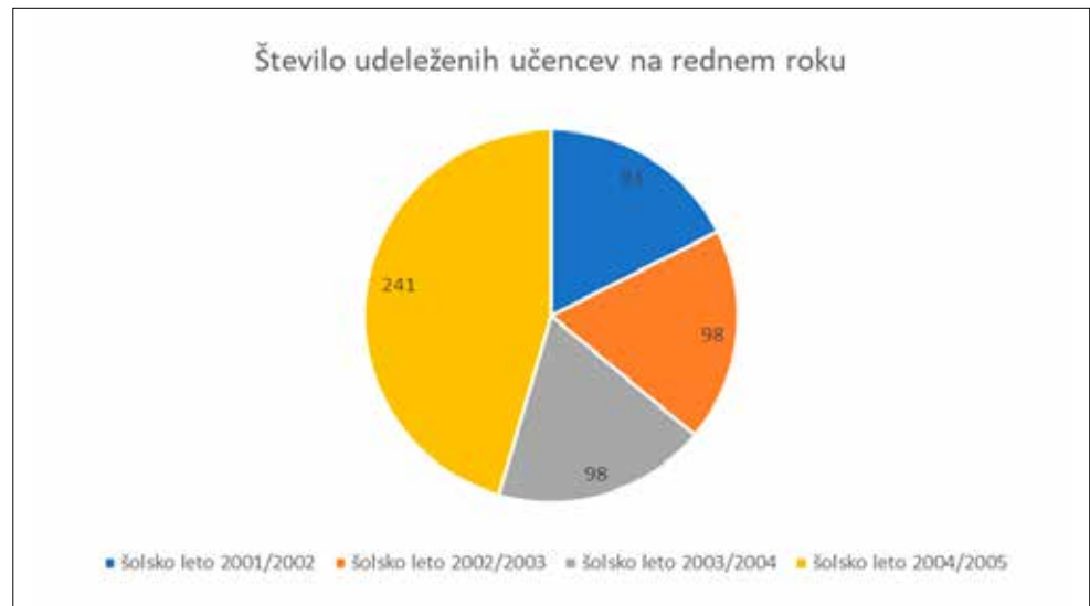
Graf 1: Število učencev in učenk na rednem roku od šolskega leta 2001/2002 do 2004/2005

izkušenj s takšnim preizkusom in se trudila zgodovino približati osnovnošolcem (Državni izpitni center, 2005a, str. 105).