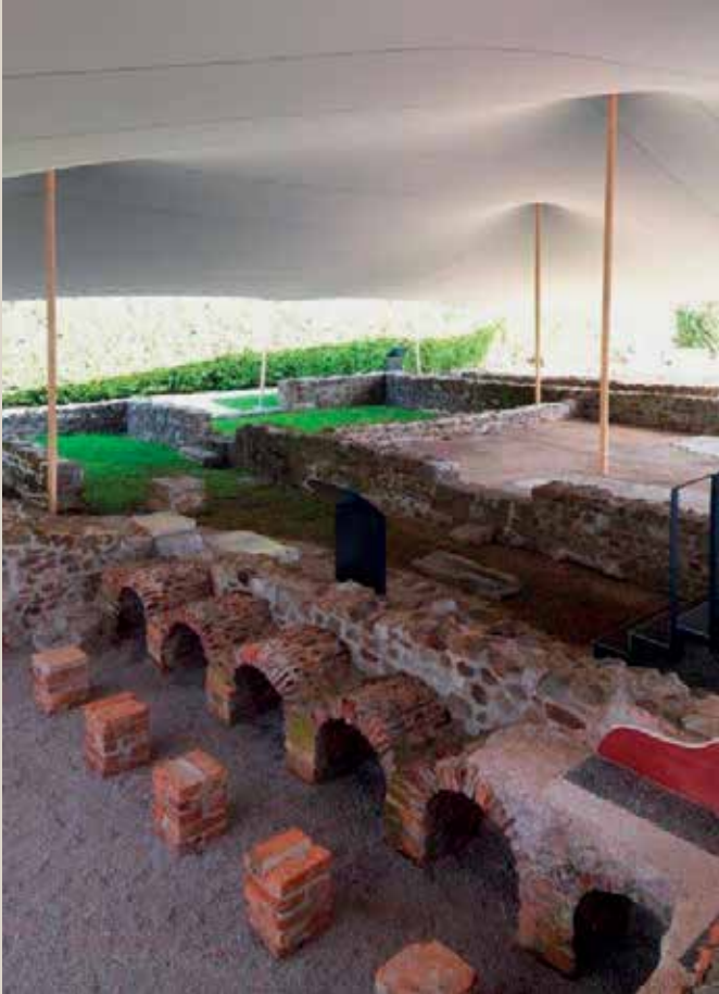
Deloma rekonstruiran prostor s hipokavstom v arheološkem parku Emonska hiša.