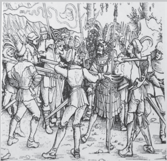
Uporni kmetje obkolijo viteza. Nemški kmečki upor 1524–1525. Lesorez iz 16. stoletja.