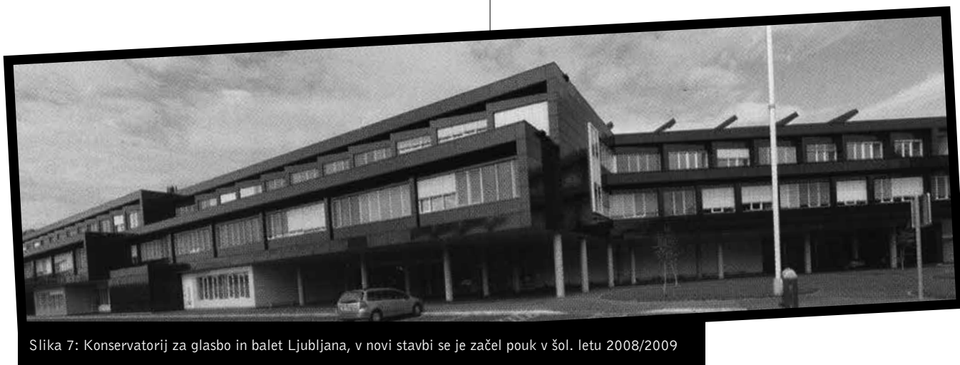
Slika 7: Konservatorij za glasbo in balet Ljubljana, v novi stavbi se je začel pouk v šol. letu 2008/2009

Za počastitev 200-letnice so bili v letu 2016 številni dogodki. Poleg omenjenih še: nastop učencev 54 glasbenih šol v počastitev 25-letnice samostojnosti Republike Slovenije in 200-letnice javnega glasbenega šolstva na Slovenskem (24. 6. 2016), 3. mednarodno klavirsko tekmovanje Aci Bertoncej (GŠ Frana Koruna Koželjskega, Velenje, 28.–29. 10. 2016), slavnostni koncert ob 200-letnici slovenskega glasbenega šolstva (Ljubljana: Cankarjev dom, 13. 11. 2016), mednarodni znanstveni simpozij Slovensko javno glasbeno šolstvo – pogledi v preteklost in vizija za prihodnost (Ljubljana: Akademija za glasbo, 16. 11. 2016) idr.