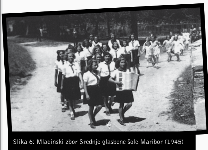
Slika 6: Mladinski zbor Srednje glasbene šole Maribor (1945)

Tudi med 2. svetovno vojno glasbena muza in s tem tudi glasbeno šolstvo na Slovenskem ni molčalo. Tako je bila proti koncu vojne (april 1945) na osvobojenem ozemlju v Črnomlju ustanovljena prva nižja (osnovna) glasbena šola. 13