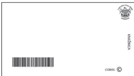
Slika 3: Začetni del učnega lista, kjer so učenci izpolnjevali manjkajoče podatke.

Ustrezno dopolni knjižnično nalepko (natančno prepisi z gradiva).