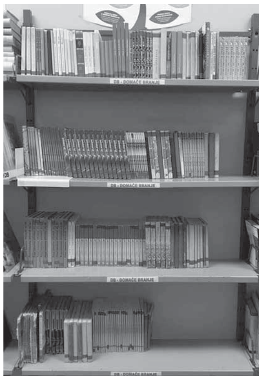
Slika 1: Pogled posebnih polic z gradivom za domače branje, ki jih knjižničar pripravi za vsako šolsko leto. Knjige imajo posebno zeleno nalepko na hrbtu (da jih učenci hitreje opazijo, če se založijo kje drugje v knjižnici).

Ko se učenci posedejo za čitalniške mize (vnaprej določen sedežni red), jim knjižničar najprej pokaže različne izdaje knjige (pona-