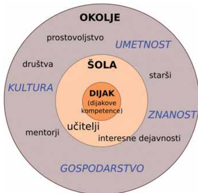
► Slika 4: Model razvijanja podjetnostnih kompetenc v gimnazijah

Končni cilj projekta je razviti oz. oblikovati model (Slika 4) razvijanja podjetnostnih kompetenc na ravni gimnazij. To vključuje že zgoraj zapisane pristope, prav tako pa model širi področje razvijanja podjetnostnih kompetenc na okolje, pod katerim razumemo dejavnike, ki lahko podprejo razvijanje podjetnosti neposredno v sodelovanju z učitelji (kultura in umetnost, znanost, gospodarstvo in druga področja), in na dejavnike, ki so s šolo povezani kako drugače (npr. društva in aktivnosti, v katere so vključeni dijaki bolj ali manj zunaj pouka). Celovitejši model bo nastal do konca izvajanja projekta, ki se zaključi 31. avgusta 2022.