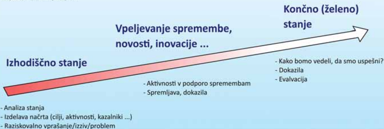
► Slika 2: Splošni pristop k razvijanju podjetnosti v gimnazijah v okviru projekta PODVIG

(Slika 2), kjer smo želeli najprej spoznati izhodiščno stanje in na teh ugotovitvah razvijati pristope za nadaljnje razvijanje podjetnostnih kompetenc in jih širiti tudi z novimi oblikami oz. načini.