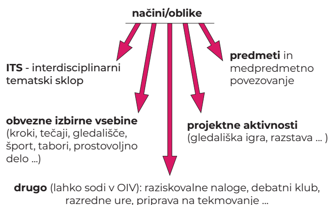
► Slika 3: Nekateri možni načini razvijanja podjetnostnih kompetenc