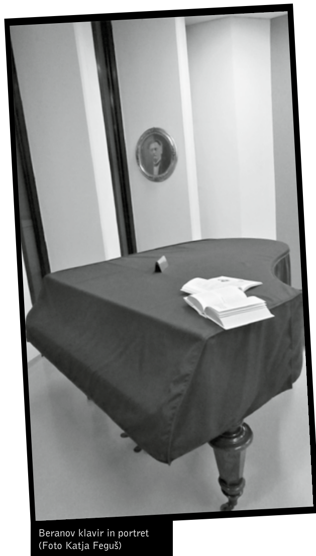
Beranov klavir in portret

Pomembno je omeniti še Repozitorij Univerzitetne knjižnice Maribor , ki se vedno bolj dopolnjuje in bogati. V njem lahko najdemo zapuščine, rokopisne zbirke, osebne zbirke in ostala