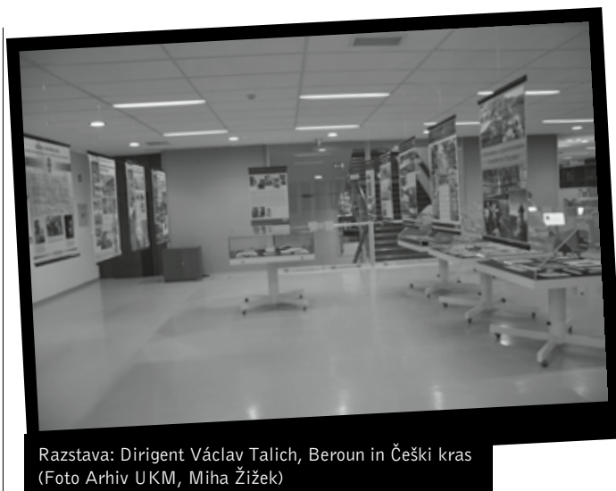
Razstava: Dirigent Václav Talich, Beroun in Češki kras