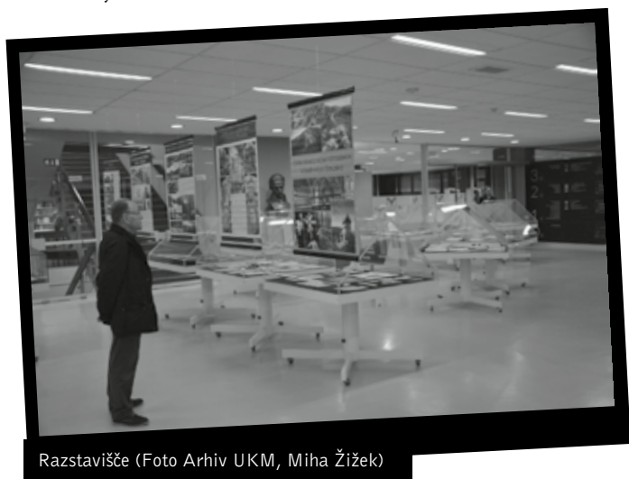
Razstavišče