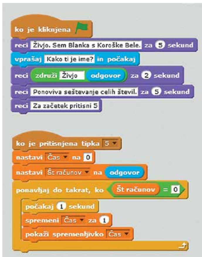
Slika 3: Podprogram za komunikacijo z učencem in za merjenje časa.