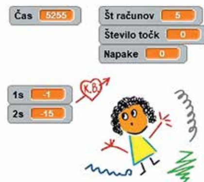
Slika 2: Zaslonko sliko

Na začetku smo predvideli računanje v množici naravnih števil do 10, 20, 100 in računanje s celimi števili, zato v nadaljevanju opišemo izdelavo aplikacije za seštevanje celih števil. Pred začetkom dela smo morali nalogo sistematično razčleniti na smiselno zaključene dele. Brez takega sistematičnega pristopa se lahko hitro prikradejo napake ali pa ne najdemo rešitve problema. Za komunikacijo z učencem uporabnikom aplikacije lahko uporabimo katerikoli lik, figurico, sliko ... Na OŠ Koroska Bela smo se odločili za deklco Blanko, ki je tudi maskota naše šole. Na sliki 2 vidimo zaslonko sliko z Blanko in spremenljivkami, ki jih vidi učenec na ekranu.