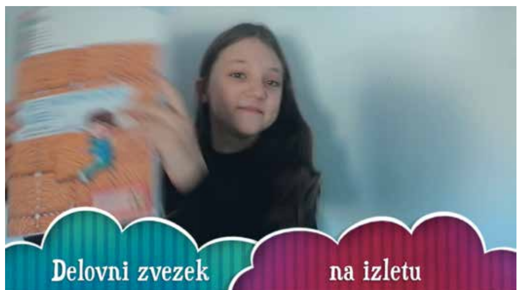
► SLIKA 2: 'Delovni zvezek na izletu'

Zaključna delavnica tega projekta je bila izvedena v živo, v šolski telovadnici, takrat so se otroci z umetnico prvič srečali tudi v živo. Poudarek te delavnice je bil na različnih kreativnih gibalno-plesnih vajah, nalogah in ustvarjalnih zadolžitvah; predvsem z uporabo in izkoriščanjem skupnega in velikega prostora, ki je prej umanjkal ter v socialnem in gibalnem sodelovanju z drugimi. Otroci so z umetnico gibalno in plesno ustvarjalni na različne družboslovne in naravoslovne tematike, ki so se jih dotaknili že tekom prejšnjih srečanj na daljavo; vendar tokrat s