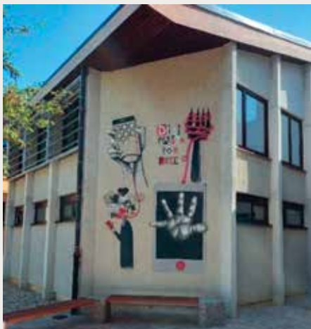
► Izdelki, nastali v projektu Upor (Gimnazija Frana Miklošiča Ljutomer)