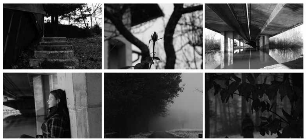
► Duh našega časa (Srednja oblikovna šola Maribor, Karin Gosak)

V okviru predmeta izražanje s sliko in zvokom (fotografija) je eden od ciljev izobraziti dijake umetniške gimnazije za osnove dokumentarne in reportažne fotografije. Učitelj je v tem videl priložnost za sodelovanje s fotografom in razširitev vsebine na ustvarjanje posameznikovih fotozgodb na temo Duh našega časa . 3 Temeljni namen je bil dijakom ponuditi fotografijo za izražanje občutkov v času, ki ga živimo. Fotograf je za dijake prek ZOOM-a pripravil motivacijsko predavanje o načinih fotografiranja in ustvarjanju fotozgodbe ter jih povabil k ustvarjanju lastnih fotozgodb na temo časa, ki ga živimo. Dijaki so se z učiteljem in fotografom kontinuirano srečevali na ZOOM-u, pošiljali fotografije in ustvarjali svoje fotozgodbe, v katerih so se zrcalila njihova občutenja in dojemanje časa, ki je za nekatere pomenil stisko, spet za druge pa najdenje in ugodje.