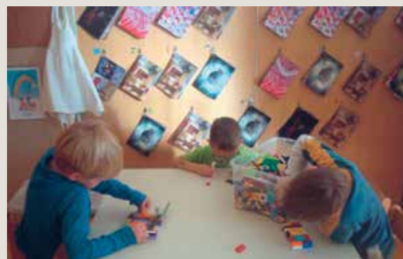
► SLIKA 6: Kotiček Cinemini v Vrtcu Jarše

V Vrtcu Jarše so filmske kartice Cinemini povezali v speti snopčič, vsak otrok jih je nato obesil v kotiček in nato sproti dodajal nove kartice ob vsakem obisku v kinu. Otrok je tako lahko samostojno kadar koli odšel v kotiček, prelistal slike, se ob izbrani ustavil, pripovedoval, ustvarjal ali pa jo pokazal vzgojiteljici in povedal, da bi si film rad še enkrat ogledal. Nalepili so jih tudi pred igralnico na oglasno desko Kino novice. Tako so o projektu, filmih in dejavnostih obveščali tudi starše ter spodbujali filmsko vzgojo tudi v domačem okolju.