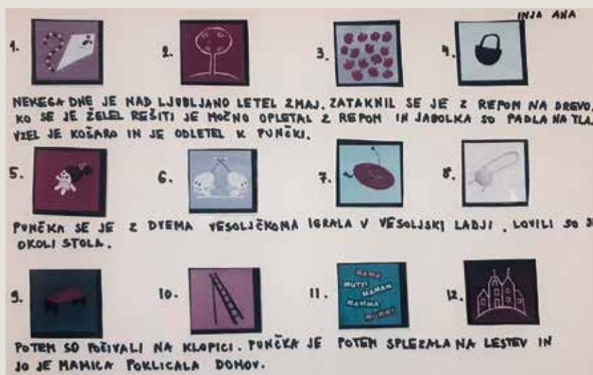
► SLIKA 2: Pripovedovanje s slikami

Odziv otrok na film Obisk z vesolja je bil poln emocij in postopnih sporočil otrok. Pogovor je začel deček, ki je želel sporočiti, kako se je počutil, ko je odšel z babico na vikend. Tam se je imel lepo, a vseeno je pogrešal svojo mamico. Pripravili