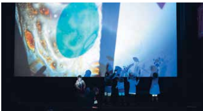
► SLIKA 4: Ustvarjanje na grafoskopu in platnu