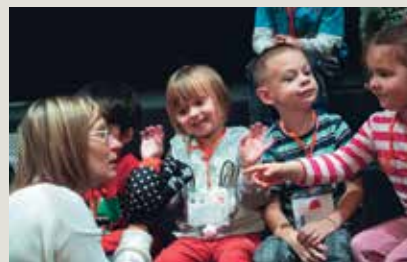
► SLIKA 1: Otroci na obisku v kinu