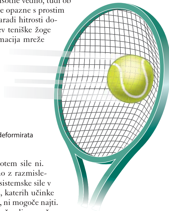
Slika 1: Žogica in mreža se ob stiku deformirata

Točka a) se nanaša na spremembe gibanja reči, torej na spremembe velikosti ali smeri hitrosti ali obojega, ter na spremembe oblike te reči/telesa. Običajno obravnavamo le eno spremembo, spremembo gibanja za gibajoča se telesa ali spremembo oblike za mirujoča telesa. Običajno manj poudarjamo, da so deformacije oziroma spremembe oblike prisotne vedno, tudi ob spremembah gibanja, in da so deformacije bolj, manj ali pa sploh ne opazne s prostim očesom bodisi zaradi majhnosti deformacije trdih površin bodisi zaradi hitrosti dogajanja. Za zavedanje tega pomagajo upočasnjeni posnetki udarcev teniške žoge s teniškim loparjem, kjer sta lepo vidni deformacija žoge in deformacija mreže (slika 1).