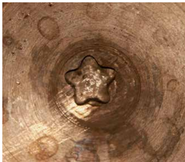
Slika 1: Problem št. 6 leta 2017: Leidenfrost stars – opazovanje pojava.

Opazil sem, da se njihov pristop k reševanju problemov spreminja: vse bolj razmišljajo zunaj ustaljenih miselnih okvirjev, pred problemom ne bežijo, ampak ga doživljajo kot izziv. Lahko bi govorili celo o raziskovalni radosti, ki jo občutijo, ko se jim razkrivajo zakonitosti sveta. Razvijajo se tudi njihove ročne spretnost in veščine, ki so potrebne za uspešno raziskovanje.