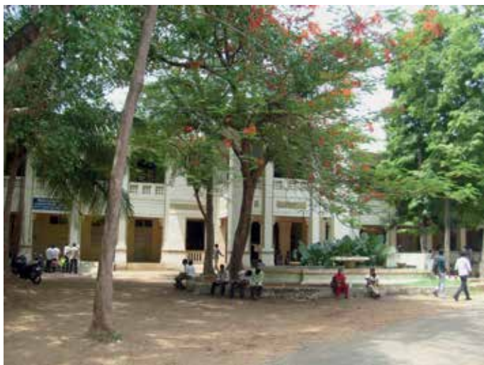
Slika 5: Državni kolidž v Kumbakonamu (današnja podoba).

Šolanje na Mestni visoki šoli v Kumbakonamu je Ramanujan končal z drugim mestom na maturi, ki so jo opravljali na madraški univerzi leta 1903, in si s tem pridobil štipendijo za nadaljnji univerzitetni študij. Januarja 1904 je tako nadaljeval študij na Državnem kolidžu v Kumbakonamu (Slika 5). Zaradi strogih zahtev študija, pa tudi lepih zgradb, ki so bile obdane z vrtom, so ga imenovali Indijski Cambridge 7 . Na njem bi moral Ramanujan dobiti najprej diplomu FA (First Arts) in šele nato bi lahko nadaljeval študij same matematike. Vendar pri študiju, ki je poleg matematike vključeval še psihologijo, grško in rimsko zgodovino ter angleški jezik, ni bil uspešen. Vrtinec preverjanja enačb iz Carrovega Synopsisa in izumljanja lastnih ga je vsega potegnil v matematiko, vse ostale predmete študija pa je povsem zanemaril. Tako konec leta 1905 na madraški univerzi ni opravil nobenega izpita za diplomu FA, razen matematike. To, da študija ni končal, je bil za doslej blestečega fanta velikanski poraz, ki ga je zelo prizadel in za vselej zaznamoval. Izgubil je štipendijo, izgubil je zaupanje vase, začel se je bati izpitov, predvsem pa se je sam pred seboj počutil osramočen navznoter še bolj kot navzven. Pobegnil je od doma v upanju, da bo daleč v mestu, kjer bo nepoznan, našel službo in notranji mir. Toda starši so ga s posredovanjem policije po mesecu mrzličnega iskanja našli v 1000 km oddaljenem mestu Vizagapatamu in ga pripeljali domov.