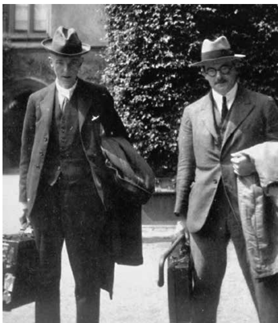
Slika 10: Hardy (levo) in Littlewood okrog leta 1924

Že v letu 1899, ko je Hardy končal z drugim delom izpita Tripas , je postal član Trinityja. Takrat je tudi pričel z objavljanjem matematičnih prispevkov, sprva v obliki vprašanj za časopis Educational Times . Prvo knjigo The integration of functions of a single variable , ki je izšla leta 1905 v sklopu Cambridge Tracts, je napisal, da bi posodobil teoretično matematiko v Angliji. Vendar se je to zgodilo šele s prelomnim učbenikom A course of pure mathematics , ki je izšel leta 1908 in ga je napisal po vzoru Jordanove Cours d'analyse . Učbenik je do leta 1952 doživel 10 izdaj in je tako še v dvajsetem stoletju močno vplival na poučevanje matematike.