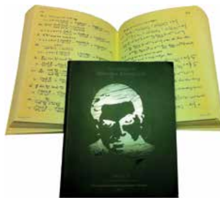
Slika 4: Druga izdaja faksimil vseh treh beležk v dveh knjigah.

Novembra leta 1897 je kot najboljši v državi Tanyor pri vseh predmetih (angleščini, tamilščini, aritmetiki in geografiji) opravil izpite in se naslednje leto samo s polovično šolnino vpisal na Mestno visoko šolo v Kumbakonamu, oddaljeno komaj 20 minut hoda od doma. S svojo neverjetno matematično zmožnostjo si je tudi tu pridobil občudovanje prijateljev, čeprav ti pogosto niso razumeli njegovih razlag. Slovel je tudi kot izjemen pripovedovalec zgodb in šal, ki se jim je tudi sam prešerno smejal. Rad je pomagal. Tako je kot srednješolec univerzitetnim študentom, ki jih je srečeval na poti do šole, reševal matematične naloge. Znana je zgodba, da je rešitev x = 9 , y = 4 sistema enačb \sqrt{x} + y = 7 , \sqrt{y} + x = 11 dobil zgolj z bežnim pogledom. S tem si je leta 1902 pridobil velikega občudovalca in prijatelja Rajagopalacharija, ki mu je osem let kasneje, ko je bil Ramanujan v hudi eksistenčni krizi, pomagal.