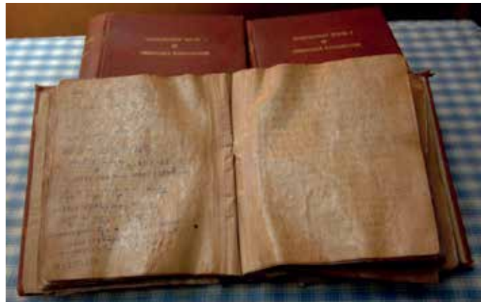
Slika 3: Originalne beležke, danes shranjene v knjižnici Univerze v Madrasu.

Rezultate je Ramanujan začel zapisovati v angleščini na liste, ki so bili osnova za slavne beležke 3 (ang. Notebooks), glej sliki 3 in 4. Pogosto je zahajal tudi v hlad bližnjega svetišča, tam sanjaril, spal na peščenih tleh in po njih računal.