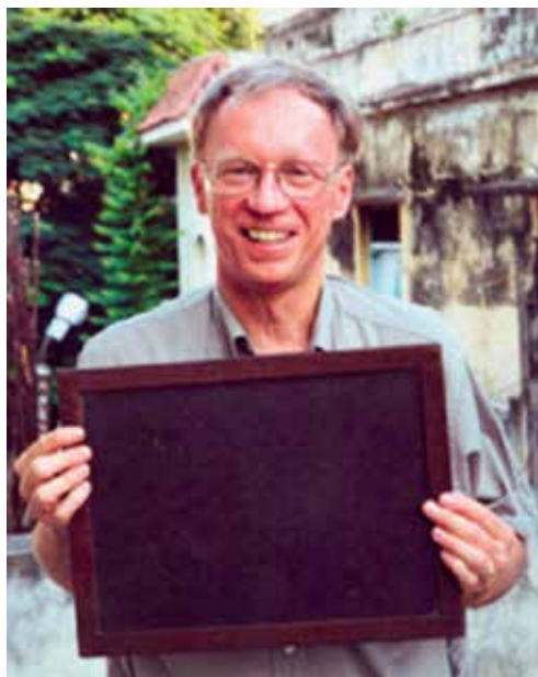
Slika 2: B. C. Berndt 2 z Ramanujanovo tablico

Večino svojega prostega časa je zaradi materine stroge vzgoje preživel doma na vrtu ali v sobi (Slika 1), kjer se je v osami zabaval tako, da je na prenosni tablici iz skrila (Slika 2) preverjal svoje enačbe in razne matematične igrice, kot so magični kvadrati. Svoja odkritja je skozi okno navdušeno razlagal vrstnikom.