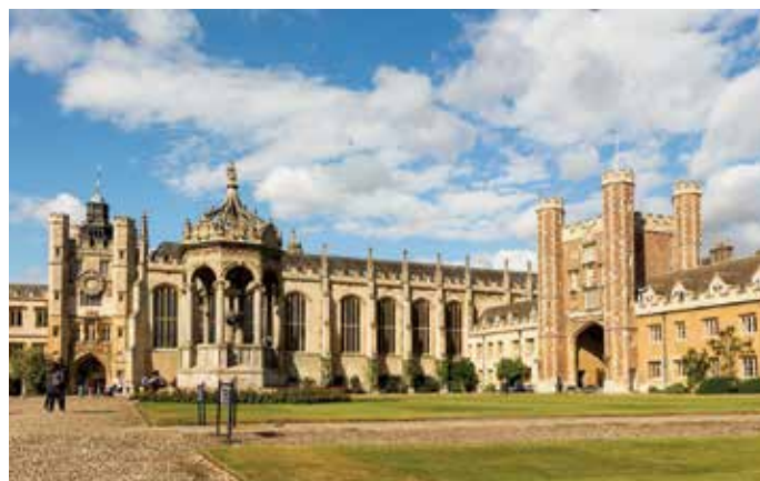
Slika 9: Trinity College, veliko dvorišče