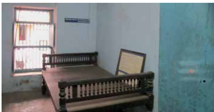
Slika 1: Ramanujanova otroška soba v Kumbakonamu

Ramanujan si zasluži več, kot obsega najvišja ocena, je izven možnosti meritve z običajnimi merili ocenjevanja. 100-odstotno znanje je zanj preslaba ocena.