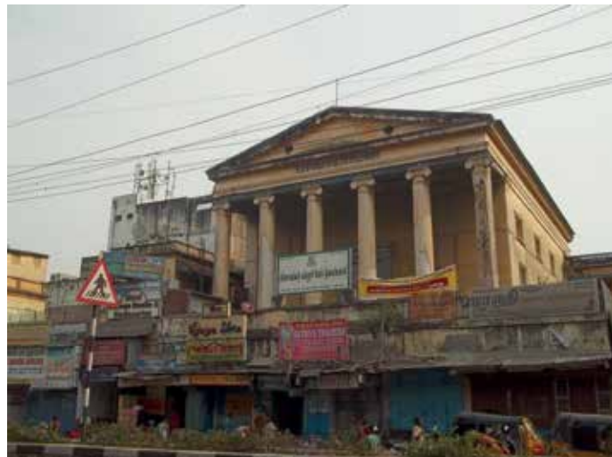
Slika 6: Kolidž Pachaiyappa (današnja podoba).

pri angleščini, sanskrtu, zgodovini in fiziologiji. Opravil je le izpit iz matematike in še tu je dosegel samo 85 točk od 150 možnih in 45 potrebnih 8 . S tem si je v Indiji za študij matematike, ki bi sledil po opravljeni diplomu FA, dokončno zaprl vsa vrata.