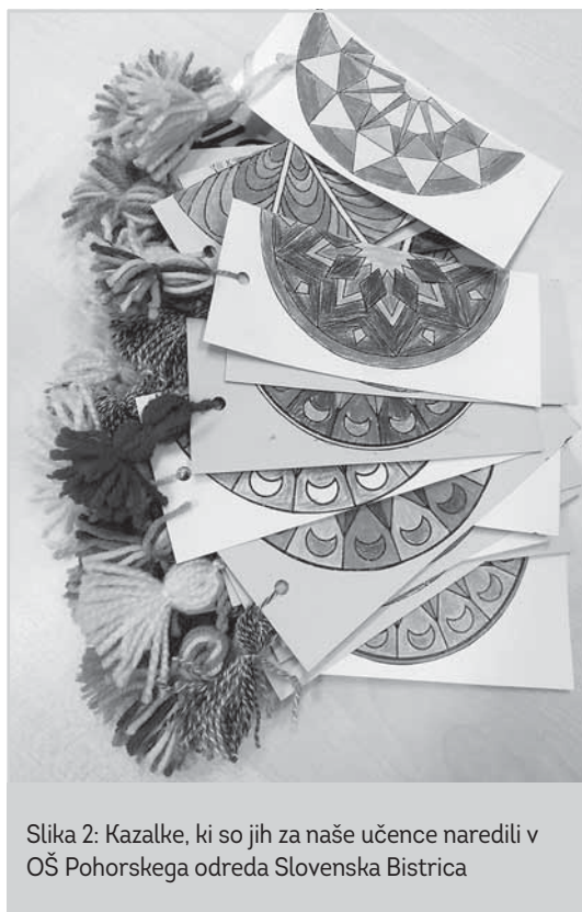
Slika 2: Kazalke, ki so jih za naše učence naredili v OŠ Pohorskega odreda Slovenska Bistrica

Deseto srečanje je bilo povezano z nacionalno izmenjavo knjižnih kazalk, ki smo jih pri krožku izdelovali oktobra. Kazalke smo si izmenjali z učenci Osnovne šole Pohorskega odreda Slovenska Bistrica (Slika 2) in knjižničarski izziv je bilo vprašanje: V katero smer bi se morali peljati, da bi prišli do Slovenske Bistrice: proti morju, proti Triglavu, proti Čateškim Toplicam ali proti Mariboru? Zanimalo me je tudi, kam bi pogledali, da bi našli odgovor, in kako daleč je Slovenska Bistrica od Ljubljane. Pri tem je bilo zanimivo, da so nekateri sicer vede-