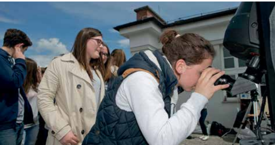
Slika 5: Prehod Merkurja na zaslonu, 9. maj 2016. Dijaki opazujejo prehod na terasi Gimnazije Jožeta Plečnika Ljubljana.