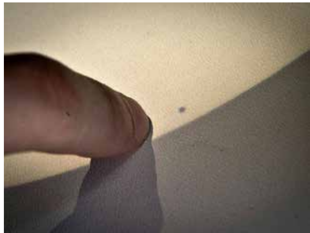
Slika 6: Prehod Merkurja na zaslonu, 9. maj 2016

Osnovna dilema je, kako številen naj bo tabor. Na ogled redkih pojavov, ki se dogajajo podnevi (Sončni mrki in prehod planetov preko Sončeve ploskvice) in jih lahko opazujemo na šoli ali v njeni bližini, povabimo vse dijake, vabilo je lahko tudi širše. Poskrbimo za zadostno število očal za opazovanje mrka in omogočimo opazovanje dogodka na zaslonu. Za projiciranje na zaslon v zasenčenem prostoru (na opazovališču) je dovolj že manjši teleskop (npr. z daljnogledom 10 x 50). Še boljše pa je teleskop (npr. Coronado) s filtrom in primeren fotoaparati ali kamero povezati z računalnikom in v zatemnjenem prostoru (učilnica ali priložnostni šotor na opazovališču) na platno projicirati dogajanje na nebu. S projiciranjem dosežemo, da dogodek doživi več dijakov (opazovalcev), kar je še posebej pomembno pri Sončevem mrku, kjer največja faza traja le kratek čas. Včasih lahko redke dogodke približamo širši javnosti preko interneta – če imamo na voljo ustrezno opremo in znanje – je pa to dodaten izziv tako za mentorja kot za dijake. Nekoliko drugačno je opazovanje Luninega mrka, ker traja dalj časa in se dogaja ponoči. Dijake na primerno lokacijo odpeljemo že popoldne, tam izvedemo predpripravo in nato opazujemo.