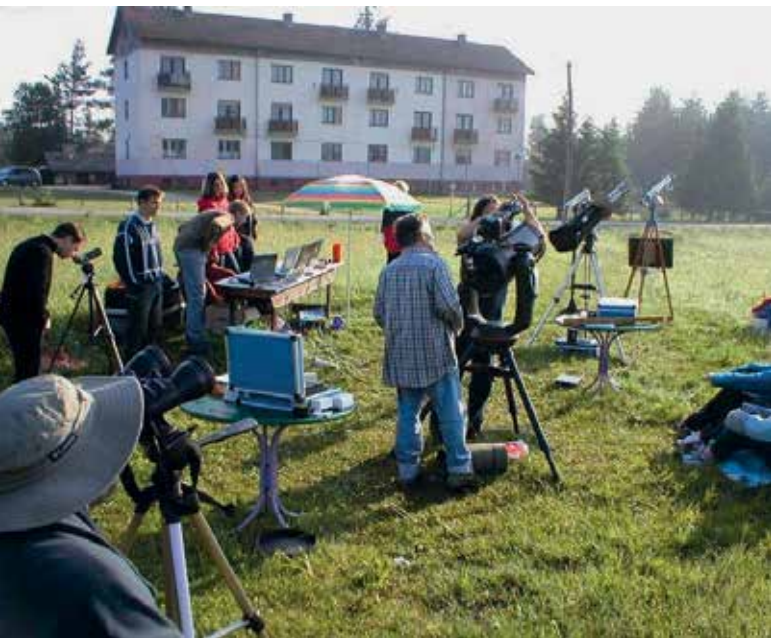
Slika 3: Dijaki Gimnazije Jožeta Plečnika Ljubljana opazujejo, slikajo in merijo prehod Venere preko Sončeve ploskve, 8. junij 2004 na Blokah.

Za opazovanje astronomskih pojavov si moramo vzeti čas. To pomeni, da se bomo z dijaki na dogodek dobro pripravili (z opazovalno vajo, ki je lahko del laboratorijskega dela pri fiziki), da bomo dogodek opazovali od začetka do konca in ga zapisali, narisali. Najtežje je dijake motivirati, da skrbno in pozorno opazujejo in da napišejo dobro poročilo. Če dijak odda kakovostno poročilo, ga lahko učitelj oceni. Ocena je enakovredna drugim ocenam pri predmetu. Če dijak naredi kakovostno poročilo, lahko učitelj to upošteva pri končni oceni predmeta.