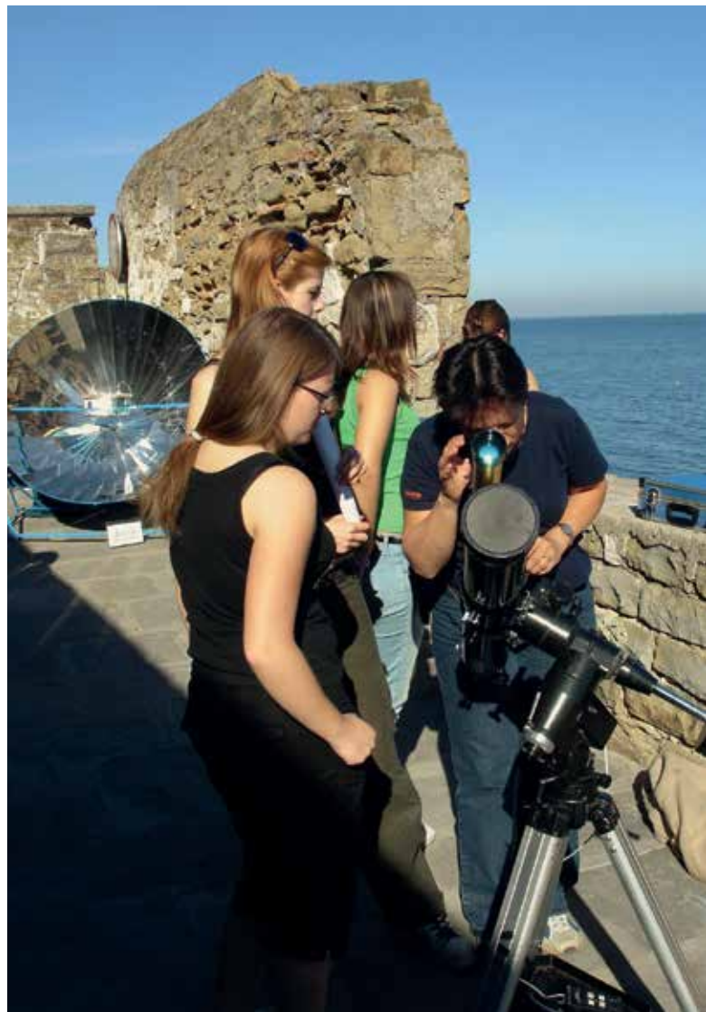
Slika 2: Dijaki opazujejo Sonce in merijo temperaturo na sončni peči na mednarodnem taboru v Piranu, Menata 1, september 2004.

Naj na tem mestu opišem pozitivno izkušnjo, kako šola lahko pomaga zmanjšati prispevek dijaka. Organiziral sem enodnevni tabor na Krimu, ker sem dijakom