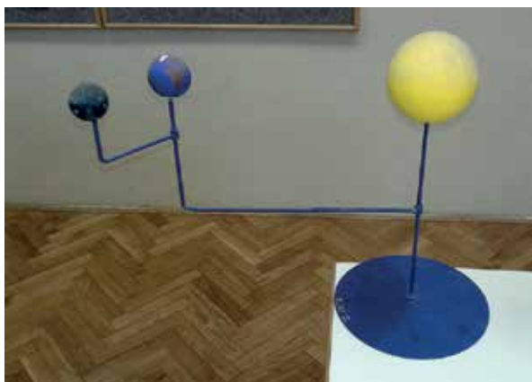
Slika 2: Model Zemlja, Luna, Sonce.

Učenci v 7. razredu zelo radi izdelujejo plakate v šoli, kjer s pomočjo virov samostojno raziskujejo in se ob tem učijo, prav tako pa sodelujejo s sošolci, kar pomeni dodano vrednost pri usvajanju snovi. Ena takih vsebin v 7. razredu je površje Zemlje, površje Lune in razlike med Zemljo in Luno.