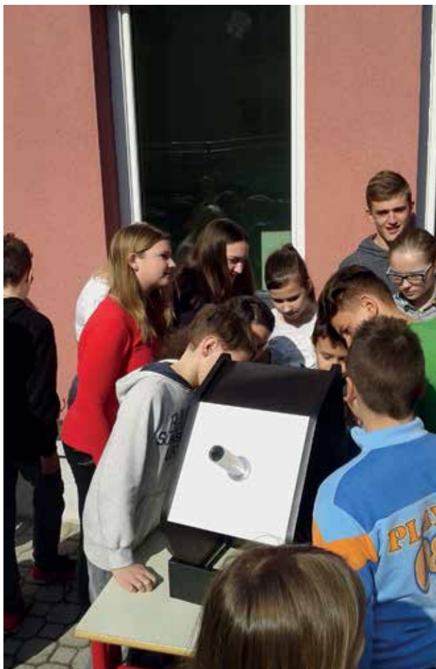
Slika 4: Opazovanje Sonca in sončnih peg s solarskopom.

Pri ocenjevanju praktičnih vaj sem pozoren na upoštevanje navodil za delo, ki jih učenci dobijo, na upoštevanje varnosti pri delu in na strokovno korektnost samega izdelka.