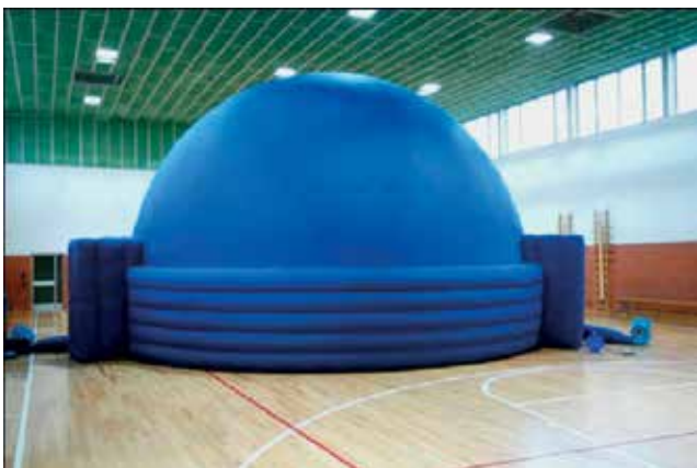
Slika 6: Prenosni napihljivi planetarij.

V 7. razredu izvedem opazovanje Lune s teleskopom Dobson (premera 20 cm) in Sonca s solarskopom (slika 4) ali s teleskopom za opazovanje Sonca (Coronado Personal Solar Telescope) (slika 5). Oba teleskopa in solarskop imam na šoli. Za vso opremo mi je uspelo pridobiti sponzorska sredstva.