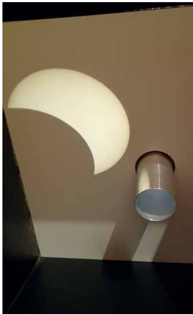
Slika 9: Opazovanje delnega sončnega mrka 20. marca 2015 s solarskopom.