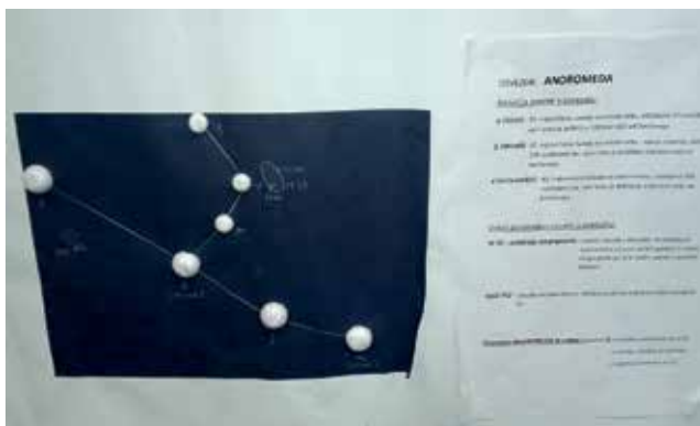
Slika 3: Ozvezdje Andromeda na plakatu.

V 9. razredu pri predmetu Zvezde in vesolje učenci izvedejo domačo praktično vajo, in sicer izdelajo maketo ozvezdja v merilu po navodilih in v določenem razmerju (slika 3).