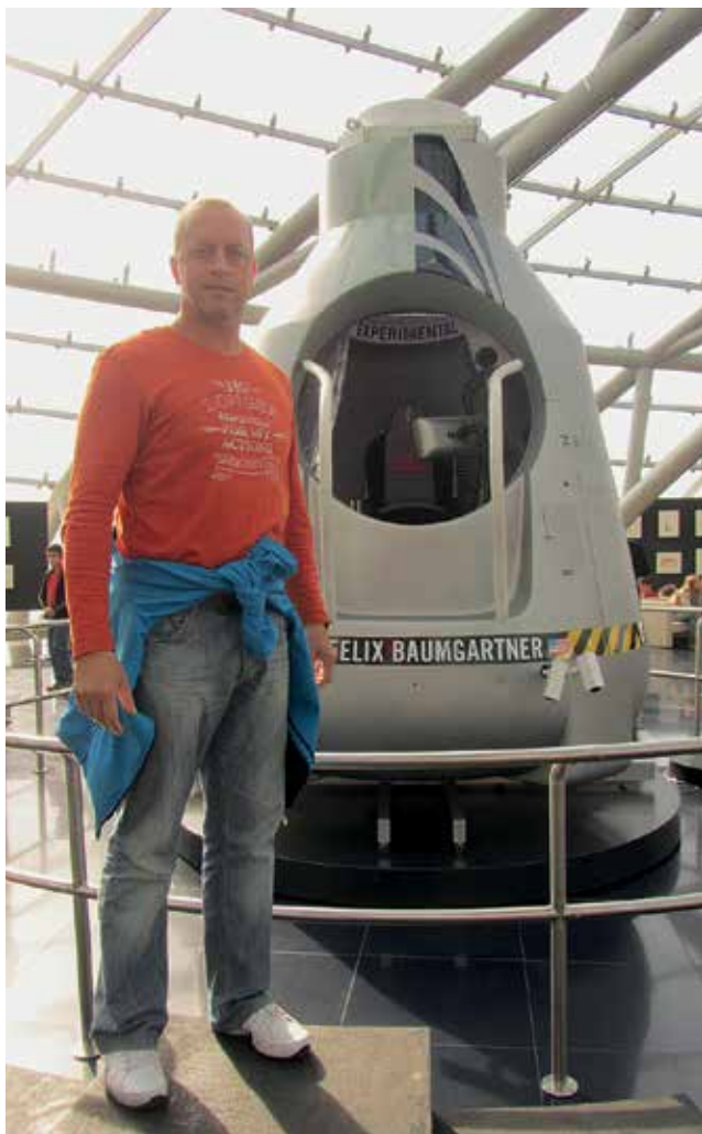
Slika 8: Originalna kapsula Felixa Baumgartnerja v muzeju Red Bull v Salzburgu.

Trudim se, da je pouk astronomije sproščen, da so učenci aktivni pri obravnavi vsebin in da sem ob koncu ure tudi sam zadovoljen. In vem, zakaj se trudim. Trudim se za otroke, za tiste, ki bi želeli vedeti več, in želim si, da bi učenci hkrati s poukom astronomije ujeli še delček romantike, ki je današnji družbi primanjkuje.