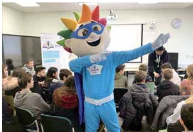
Slika 2: Karierni kviz s Trkajem, ambasadorjem poklicev pri Kariernem placu

Šolajočim mladim ponujamo tudi individualna karierna svetovanja, pri katerih jih strokovno opolnomočimo, da raziščejo možnosti osebnega razvoja, si postavijo cilje, potrebne za doseg želenega cilja, sprejmejo odločitve, ki vodijo do realizacije ciljev ter tudi do vzdrževanja in nadgrajevanja želenega stanja.