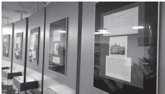
Slika 2: Razstava ob 100. obletnici rojstva Staneta Habeta in 70. rojstnem dnevu Glasbene šole Domžale

Uporabnikom, tj. predvsem učencem in učiteljem glasbene šole, pomagamo pri iskanju določenih informacij oziroma gradiva, ki ga potrebujejo za pouk. Knjižnica je v pomoč tudi pri izvajanju drugih aktivnosti glasbene šole. V šolskem letu 2019/20 smo na primer izbrali pravljico, po kateri smo z dvema učiteljicama in učenci pripravili jesenski mini koncert, namenjen najmlajšim poslušalcem (do 6. leta starosti) in njihovim staršev. Ob pripovedovanju pravljice so učenci predstavili inštrumente, ki jih učitelji poučujejo na naši glasbeni šoli. V šolskem letu 2020/21 pa smo v splošni knjižnici v našem lokalnem okolju pripravili razstavo ob 70. obletnici ustanovitve Glasbene šole Domžale in 100. obletnici rojstva glasbenega pedagoga Staneta Habeta, ki je bil tudi dolgoletni ravnatelj naše glasbene šole.