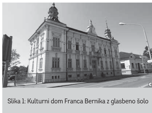
Slika 1: Kulturni dom Franca Bernika z glasbeno šolo