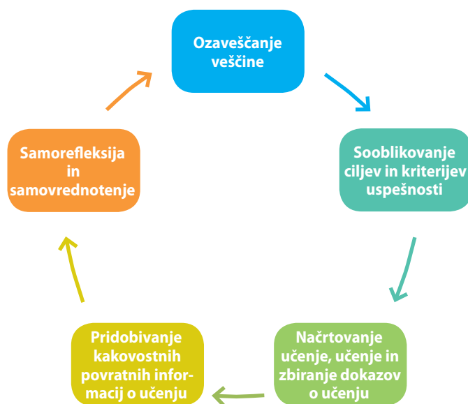
Slika 2: Moje učenje (My Learning Cycle) – shematski prikaz korakov učnega procesa učenca (ki običajno niso linearni, pač pa prepleteni).