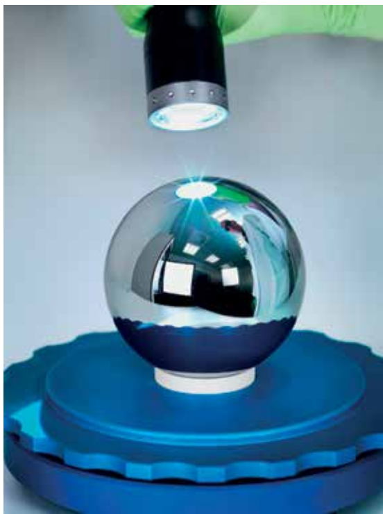
Slika 1: Krogla iz čistega silicija, ki je ta hip najbolj okrogel predmet na Zemlji. Težka je en kilogram, iz njene sestave in mer pa je mogoče določiti njeno težo s podobno negotovostjo, kot to lahko dosežemo s Kibblovo tehtnico.

Eden od najpomembnejših pogojev je seveda bil, da redefinicija ne bo povzročila nobenih sprememb za uporabnike, kar pomeni, da se velikosti enot ne bodo spremenile.