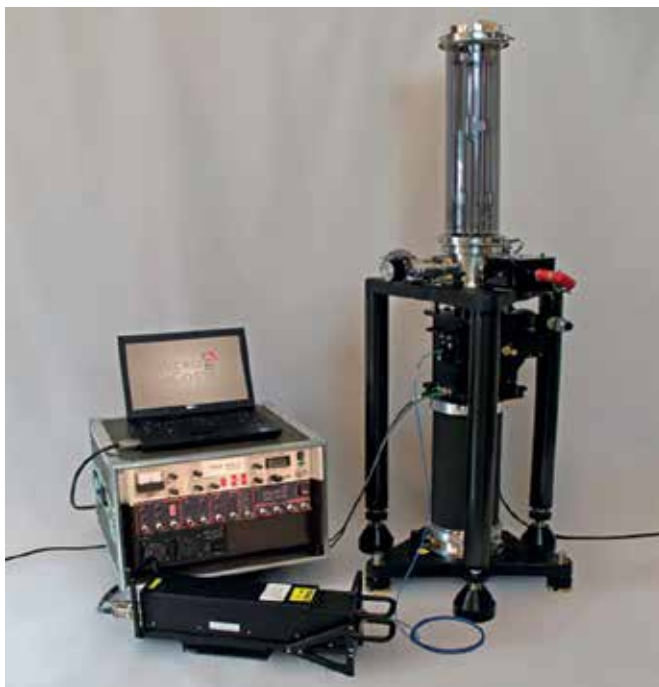
Slika 4: Instrument FG5-X podjetja Micro g LaCoste, ki z merjenjem padca ogledala meri težnostni pospešek g na izbrani lokaciji.

prostem padu spuščamo na razdalji nekaj decimetrov, pri tem pa z laserskim interferometrom in s števcem časovnih intervalov natančno merimo pot in hitrost ogledala pri padcu (slika 4). Laserski interferometer pri padanju ogledala ustvarja signal z naraščajočo frekvenco, ki pri razdalji padca 20 cm zaniha kar 640-tisočkrat, njegova frekvenca pa na koncu doseže 6 MHz. S hitrim ponavljanjem (tudi do tri meritve na sekundo!) zberemo toliko meritev, da lahko ustrezno zmanjšamo vpliv naključnih napak. Meritve so tako točne, da lahko izmerimo tudi lokalne spremembe gravitacijskega polja zaradi plime in oseke, zračnega tlaka, premikanja osi vrtenja Zemlje in gravitacijskega polja bližnjih težkih objektov. Zdaj je pot za takšen razvoj odprta tudi na vseh drugih področjih merjenj in z njimi povezanih tehnologij.