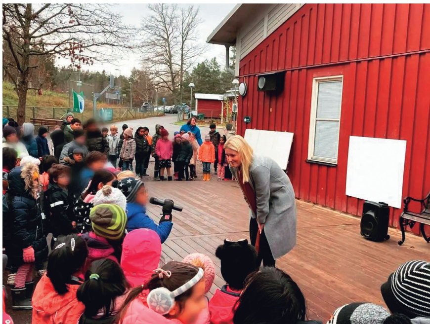
Z učenci na šoli lansko jesen, ko smo praznovali, da smo bili izbrani med 5 najbolj trajnostnih šol na Švedskem.

vrtec sta imela v lanskem letu enodnevno Storyline izobraževanje, ki smo ga pripravili na šoli prav na temo trajnostnega razvoja. Po seminarju sem opazila, da smo prešli na višjo raven razumevanja, kako učinkovito poučevati za trajnostni razvoj.