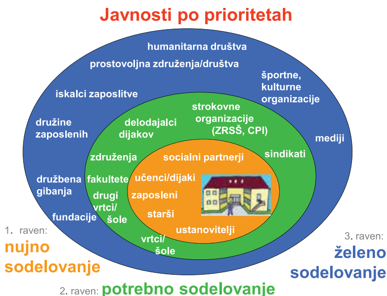
Slika 1: Razdelitev javnosti po prioritetah.

Področja oziroma ravni sodelovanja vrtca in šole z okoljem lahko po nujnosti razdelimo na nujno sodelovanje, potrebno sodelovanje in zeleno sodelovanje. Pomembno se je vprašati, katere so prioritete našega vrtca oziroma šole pri sodelovanju z okoljem glede na naše poslanstvo, program/-e, ki ga/jih izvajamo, in kakšno korist imajo naši otroci oziroma učenci od tega sodelovanja. S katerimi javnostmi je torej sodelovanje nujno, kdaj je sodelovanje potrebno in kdaj gre za zeleno sodelovanje.