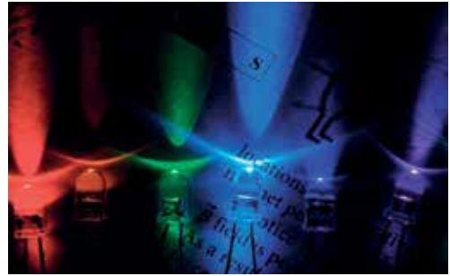
Slika 2: Mavrica svetlečih diod: rdeča, rumena, zelena, modra, ultravijolična, roza in bela.

Dvojne zvezdice [**] pa označujejo primere, ki so (kolikor nam je znano) novi.