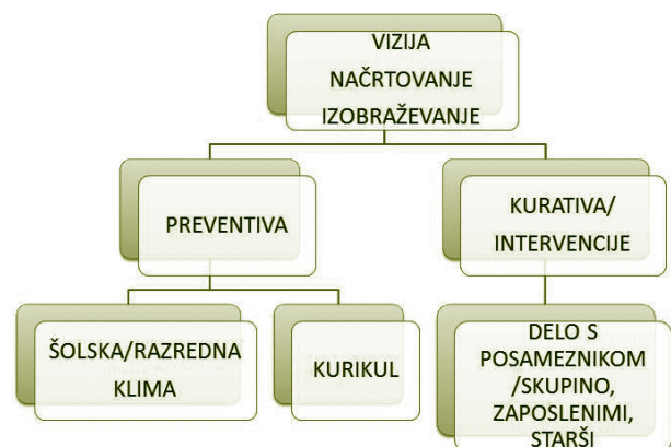
Slika 1: Potek projekta na šoli.

Osnovna šola Simona Jenka Kranj je ena izmed večjih šol v Sloveniji. Poleg Matične šole (učenci 2 od 1.–9. razreda) ima šola še večjo Podružnično šolo Center (učenci od 1.–9. razreda) in manjše Podružnične šole Primskovo, Goriče in Trstenik (učenci od 1.–5. razreda) ter pet oddelkov vrteca na dveh lokacijah. Skupaj obiskuje šolo približno 1100 učencev in vrtec 100 otrok. Na šoli je zaposlenih 140 strokovnih delavcev in podpornega osebja. Posamezne projektne aktivnosti potekajo na vseh šolah, največ dejavnosti pa se odvija na Podružnični šoli Center in v sedmih razredih Matične šole, kar pomeni približno 350 učencev od prvega do devetega razreda.