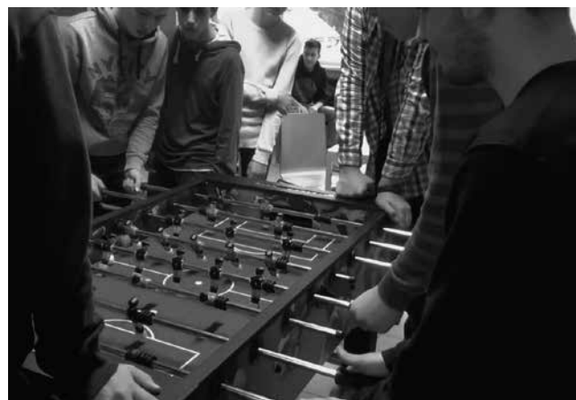
Slika 3: Igranje namiznega nogometa v modri sobi

Največ časa se zadržijo pri igranju ročnega nogometa. Ta ne sameva v nobenem odmoru. Včasih se jim pridruži tudi kateri od učiteljev. Zaznali smo porast medgeneracijske komunikacije; želja po zmagi v namiznem nogometu je pomagala premostiti starostne razlike in zaznali smo splet novih prijateljstev in poznanstev.