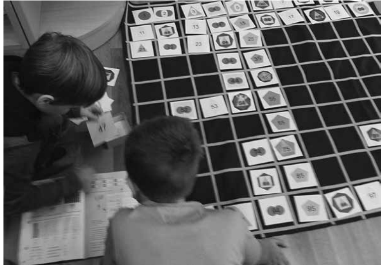
Delo v učilnici

ki sicer izstopajo in potrebujejo več individualnih usmerjanj, spodbud ali pa samo pozornosti. Menim, da je ključnega pomena tudi to, da pri vsakodnevnih dejavnostih z otroki razvijam ustrezno in spoštljivo komunikacijo, ki vodi k vzpostavitvi dvostranskega zaupanja in posledično občutka varnosti s strani otrok.