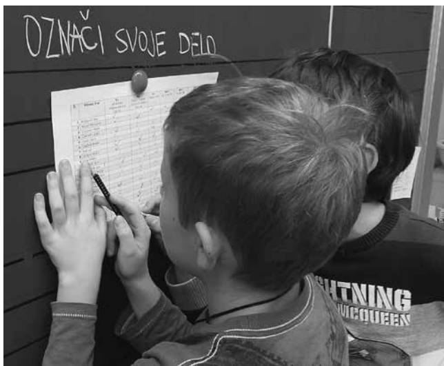
Načrt za delo

strani učitelja, lahko v pouk vključimo tako, da oblikujemo okviren urnik, ki je namenjen manjšemu številu otrok, ki se zberejo ob predstavitvah določenih vsebin.