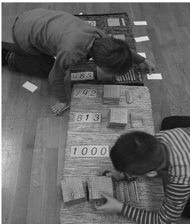
Delo v učilnici

uporabljam tudi gradiva montessori, s pomočjo katerih otroci poglobljajo določena znanja oziroma jim pomagajo pri prehajanju iz konkretnega v abstraktno mišljenje. Tukaj je seveda potrebnega nekoliko več postopnega predhodnega dela, saj je otroke treba seznaniti z načinom dela in uporabo gradiv. Sam stremim k omejenosti posameznih gradiv, kar pomeni, da tistih, ki niso namenjena temu, da jih vsak posameznik shrani, ni v izobilju. To pomeni, da vsi otroci hkrati ne morejo izbrati enakega gradiva za delo. Tako se otroci učijo organizirano prehajati med posameznimi dejavnostmi ter med seboj več sodelujejo, se usklajujejo in sporazumevajo. Poleg pripravljenih gradiv učenci prav tako uporabljajo delovni zvezek in učbenik.