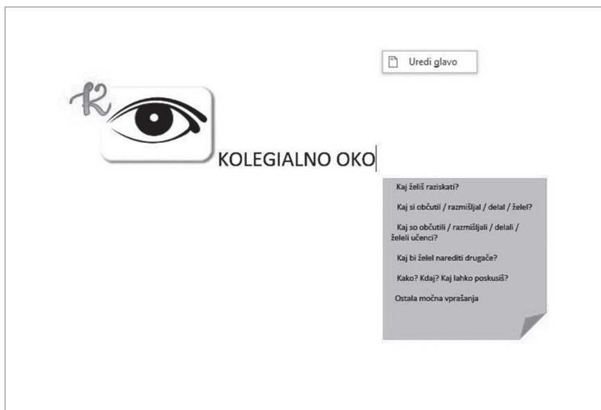
Slika 2: Obrazec Kolegialno oko