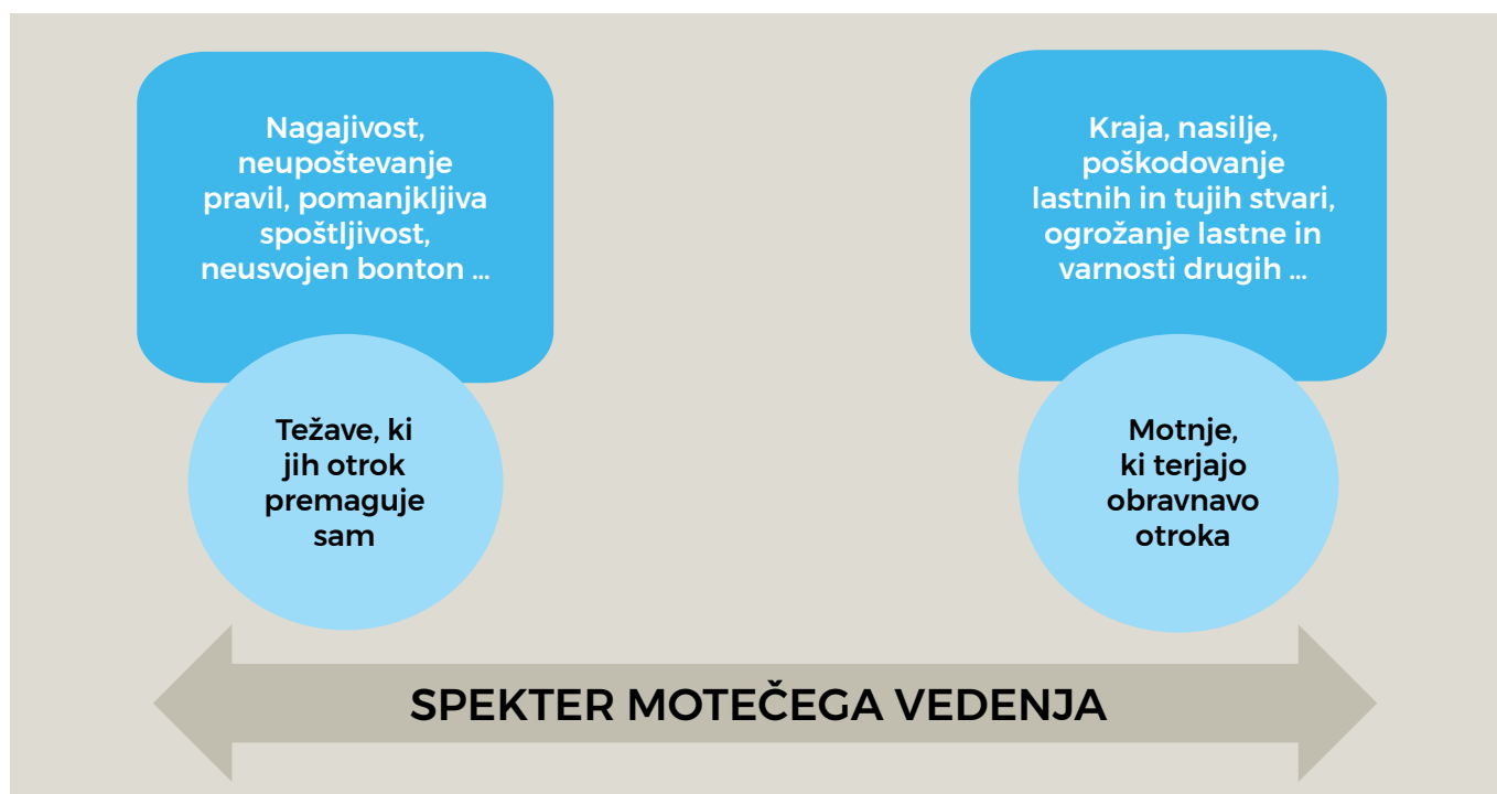
► PRIKAZ 1: Kontinuum motečega vedenja (Vec, 2011)

Moteče vedenje se lahko stopnjuje do motenj vedenja. Razvojno ali socialno pogojeno manj primerno vedenje otrok največkrat premaguje sam – prek socialnega učenja znotraj dane situacije, prek doživljanja njemu neprijetnih posledic, v teh primerih ne potrebuje strokovne pomoči.