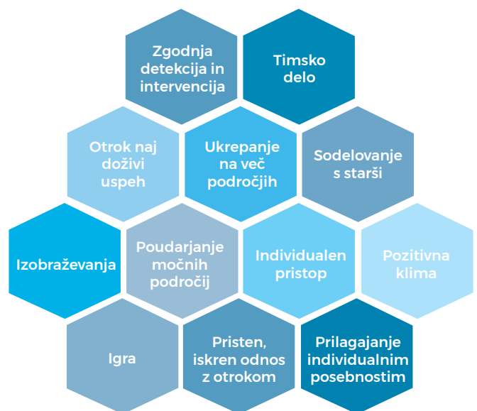
► PRIKAZ 2: Splošne smernice za dobro poučevalno prakso (Križnar, 2017)

Pri delu z učencem, pri katerem opažamo primanjkljaje na področju vedenja, moramo navadno ukrepati na več področjih njegovega življenja. Nemalokrat posegamo v družinske odnose, v odnose z vrstniki ter seveda na področje učnih težav oz. primanjkljajev na posameznih področjih učenja. V poučevalno prakso po zmožnostih vključujmo element igre, saj bo ta dvignila nivo otrokove motiviranosti, izboljšala njegovo koncentracijo ter spodbudila pomnjenje učnih vsebin. V otroku oz. mladostniku bo krepila občutja zadovoljstva in tako ugodno vplivala na njegov celostni razvoj.