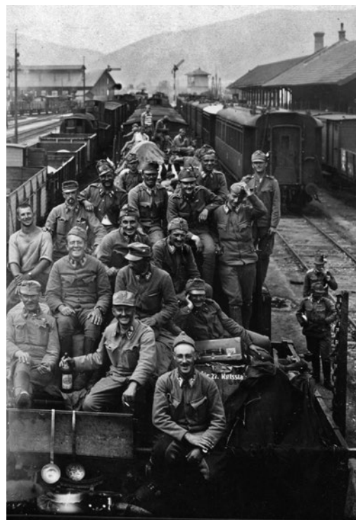
Vojaki 27. domobranskega pehotnega polka na vlaku na poti iz Galiciji, 18. avgust 1916.

Mobilizacija italijanske vojske je bila počasna in prva ofenziva se je začela šele 23. junija, zato so branilci pod poveljstvom generala 5. armade Svetozarja Borojeviča in generala Franza Rohra na severnem delu bojišča uspeli sestaviti skromno obrambno črto. Za ustavitve trikrat številčnejšega nasprotnika so izkoristili naravne danosti terena, razstrelili cestne in železniške mostove ter poplavalili območja ob izlivu reke Soče. Zaradi težko prehodnega in za bojevanje neprimerne visokogorja in številnih zapornih trdnjav v smeri Južne Tirolske in Koroške se je italijanski vrhovni štab odločil za napad proti vzhodu v smeri reke Soče. Načrtovali so ofenzivni prodor prek kraške planote in postojnskih vrat