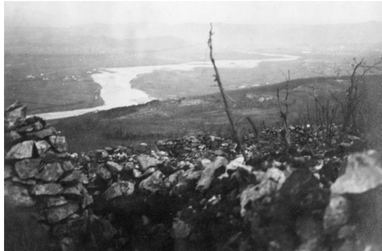
Pogled proti Soči s položajev 17. pehotnega polka na kraškem robu, Šmihel/S. Michele, 10. november 1915.

v notranjost monarhije. S tem bi v skladu s svojimi strateškimi načrti Avstro-Ogrski zadali smrtni udarec in jo izločili z vojne. Pomembna vojna in politična cilja sta bila zasedba Trsta in Gorice ter dokončanje procesa združevanja z »neosvobojenimi brati«, živečimi za avstro-ogrskimi mejami v obalnih mestih in na Tridentinskem. Poveljnik italijanskih sil, ki naj bi izpeljal zahtevno nalogo, je postal general grof Luigi Cadorna. Bil je zagovornik zastarelih strateških vojaških konceptov in ustvaril je strogo hierarhično vodenje, ki je podrejenim puščalo malo iniciative, kar se na bojišču ni najbolje obneslo. Zamenjal je številne častnike, ki jih je krivil za neuspehe in najstrože je kaznoval dezertarje. Število smrtnih kazni je naraščalo in med svojimi podrejenimi je bil vse manj priljubljen.