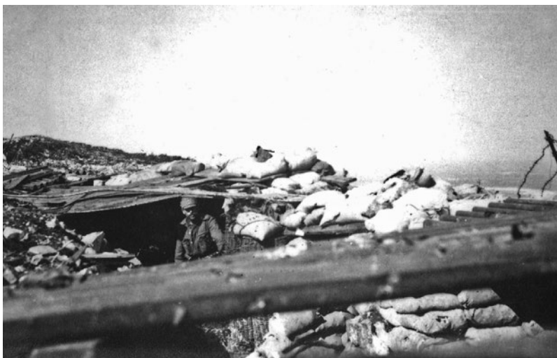
Avstro-ogrski vojak v strelskem jarku na Krasu.

od 18. julija do 3. avgusta, so napadalci kljub velikim izgubam osvojili le ozek pas kraškega ozemlja med Martinščino in Grižo. Italijanskim gorskim enotam je julija 1915 uspelo zasesti Krn in avstro-ogrsko vojsko prisiliti k umiku na rezervne položaje na Batognici. Avgusta 1915 je bila 5. soški armadi dodeljena glavnina 3. korpusa, v okviru katerega so bili polki iz slovenskih nabornih okrajev, ki so se pridružili pohodnim bataljonom, ki so jih na soško bojišče napotili že takoj ob začetku spopadov z Italijo. Med vojaškimi enotami z visokim odstotkom slovenskega moštva je le 97. tržaški polk zaradi svoje italijansko-slovensko-hrvaške narodne sestave ostal na vzhodnem bojišču. Na soško bojišče so poslali le njegov 10. pohodni bataljon, v katerem so služili številni primorski domačini. Dodeljeni so jim bili nekateri najbolj izpostavljeni položaji, na katerih so si zaslužili častni naziv Soški bataljon.