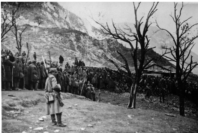
Ujetniško taborišče pri Kneži.