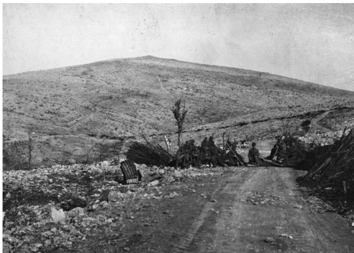
Fajtji hrib, 28. oktober 1917.

ski vojaki, ki so bili poslani v ujetniška taborišča in delavnice v notranjosti monarhije. 21 Ljubljanski grad je z dolgo tradicijo kaznilnice postal karantenska postaja za italijanske vojne ujetnike. Med ujetniki v zaledju Kranjske in Štajerske je bilo tudi nekaj deset tisoč ruskih ujetnikov z galicijske fronte, ki so v izjemno težkih pogojih delali v vojaških delavnicah in gradili železniške proge, vodovode in ceste. Tudi številni slovenski vojaki so prišli v dolgotrajno italijansko vojno ujetništvo. Zajeti so bili v bojih na soškem bojišču in reki Piavi ali ob koncu vojne kot vojaki kranjskega 17. pehotnega polka. 22