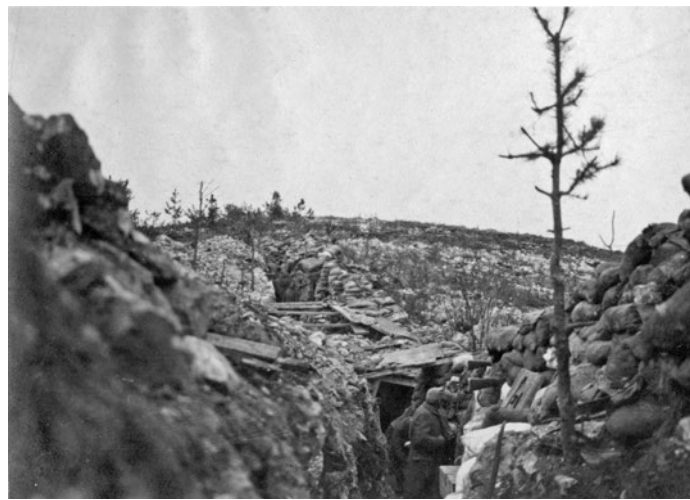
V avstro-ogrskem strelskem jarku na Šmihelu, 16. december 1915.

so vztrajali na svojih domovih vse do njenega padca tudi sredi najhujšega italijanskega topniškega obstreljevanja. Podobno so želeli posamezni prebivalci bolj ali manj uspešno vztrajati na svojih domovih v nasprotju z navodili vojaških oblasti na območju Kanala in še kje. Po italijanski zasedbi Gorice, Solkana in drugih krajev na levem bregu Soče se je tudi avstro-ogrška vojska na Krasu zaradi nevarnosti obkolitve umaknila na nove obrambne položaje in prepustila nasprotniku Doberdobsko planoto. Sledil je novi val goriških beguncev in hrib Sveti Gabrijel, danes bolj znan kot Škabrijel, je kmalu postal najpomembnejša točka avstro-ogrške obrambe. Novi obrambni položaji so septembra 1916 na Krasu potekali na črti Vrtojba–Lokvice–Nova vas–Jamlje. Razmere pri Hudem Logu v času osme italijanske ofenzive je opisal Ivan Matičič: »Kako je vse smrdelo! Po mrličih, po nesnagi, po trohnohi in mrhovini. Kako je ležalo vsevprek in počez razmetano, vse blatno, okrvavljeno! Jarki so bili že stari, dobro utrjeni, a sedaj, ko je šla preko njih osma bojna vihra, so bili razsuti, razdejani. Trebalo je bilo delati z vso naglico in si utrjevati položaj, ker kdo ve, kaj pride jutri ali že nocoj!« 24