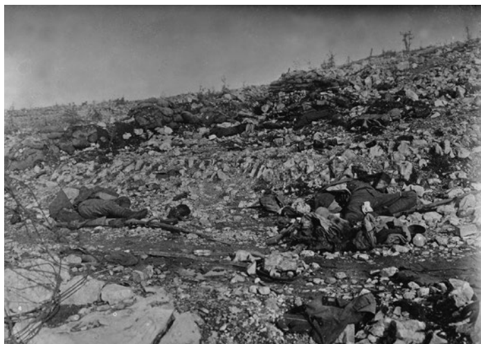
Posledice bojev na kraški pokrajini: cesta pri Kostanjevici proti Fajtjemu hribu po končanih bojih, 1. marec 1918.

V prvih petih ofenzivah se kljub velikemu številu mrtvih položaji na bojišču niso bistveno spreminjali. Marca 1916, po 5. soški bitki, so bili slovenski vojaki v večjem številu premeščeni na južnotirolsko bojišče na območje severno od Asiaga zaradi priprave velike avstro-ogrsko ofenzive, tako imenovane »kazenske ekspedicije«, ki je skušala z obkolutvijo in presekanjem preskrbe 1. in 2. italijansko armado prisiliti k vdaji. Avstro-ogrski napad se je začel 15. maja in se je moral po začetnih uspehih zaradi uspešne ruske ofenzive na vzhodnem bojišču ustaviti. Pomembna prelomnica na soškem bojišču se je zgodila avgusta 1916, ko je italijanska vojska zasedla enega najpomembnejših obrambnih stebrov goriškega mostišča, hrib Sabotin. Avstro-ogrsko poveljstvo je bilo prisiljeno ukazati umik vojske in preostalih prebivalcev iz Gorice na levi breg Soče in porušenje mostov: »Vest, da je padla Gorica, katero je tudi naša baterija celih pet mesecev branila, nas je vse iznenadila. Kako je mogoče? Štirinajst in pol mesecev jo je napadal sovražnik, jo vso razbil, toda zavzeti je ni mogel.« 23 Gorice avstro-ogrsko oblasti dolgo niso želele izprazniti in posamezni prebivalci