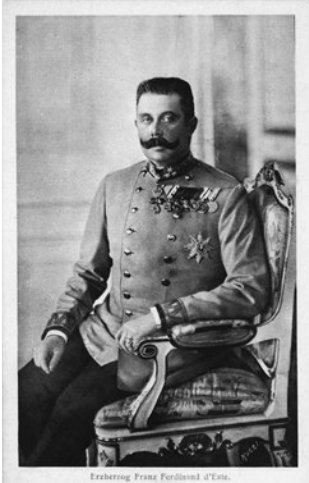
Nadvojvoda Franc Ferdinand d'Este.

dar sta glede trializma obstajali dve možnosti. Prva je želela zadostiti starim zahtevam Čehov po več enakopravnosti. Nastala bi avstro-ogrsko-češka država. Druga možnost je bila vključitev južnih Slovanov v troedino državo. Po tem načrtu pa bi nastala avstro-ogrsko-jugoslovanska država. Vendar je treba poudariti, da navedena imena za preurejeno monarhijo nikoli niso prišla v poštev, saj je že poimenovanje avstro-ogrsko spominjalo na delitev monarhije. Že ti dve možnosti trialistične ureditve države kažeta na različna mnenja sodelavcev prestolonaslednika znotraj belvederskega kroga. Na kritičen odnos prestolonaslednika do vpliva Madžarov in krepitev nemškega nacionalizma je opozoril tudi Fran plemeniti Šuklje, ki je v svojih spominih o nazorih Franca Ferdinanda zapisal: »Saj je jasno uvideval, da pod vlado odrevenelega starca Franca Jožefa starodavna habsburška država kar drvi proti prepadu! Madjare je sovražil, istotako so mu bili zoprni nemški radikalci, ki so poleg svojih političnih izgrediv žalili njegovo živo katoliško prepričanje.« 19 Zgodovinske reformne načrte Franca Ferdinanda ocenjuje različno. Vendar pa velja poudariti, da se je prestolonaslednik zavedal moči sodobnih narodnopolitičnih gibanj za enakopravnost posameznih narodov habsburške monarhije. 20