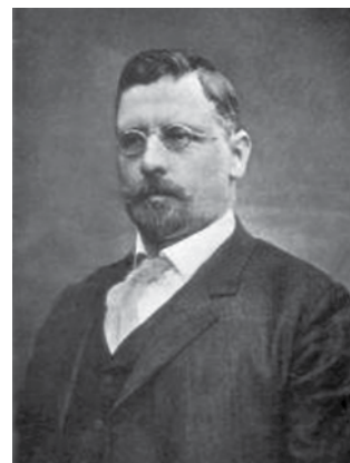
Ivan Šusteršič (1863–1925).