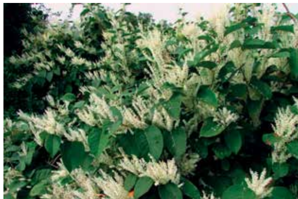
Slika 2: Japonski dresnik.