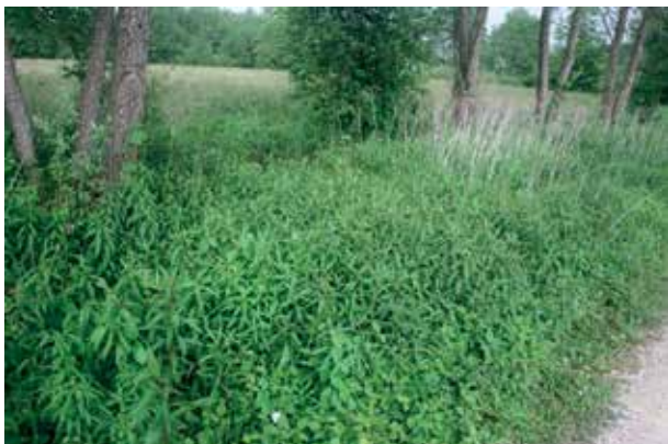
Slika 1: Zlata rozga na Ljubljanskem barju.