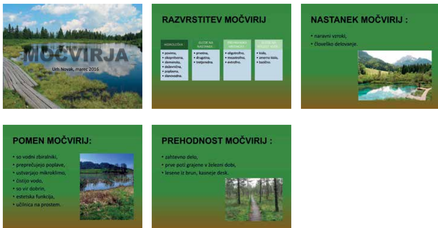
Slika 3: Primer posameznih, že popravljenih prosojnic v predstavitvi