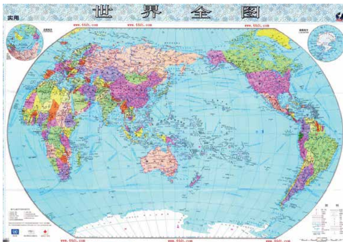
Slika 1: Karta sveta, izdana v LR Kitajski

Pri poučevanju zgodovine in geografije morajo otroci iz LRK v slovenskih šolah poleg jezikovne ravni usvojiti še specifično, lahko bi rekli evropocentrično razumevanje sveta in preteklosti, ki se je uveljavilo na Zahodu in kateremu sledi tudi slovenski izobraževalni sistem. Ta je v tem okolju normativen in zelo redko prevpraševan ali vsaj postavljen v kontekst z drugimi tovrstnimi nazori, na primer sinocentrističnim, ki postavlja v ospredje Kitajsko. Med drugim gre pri tem na primer za samo kartografsko predstavitev sveta, na kateri je v Sloveniji uveljavljen prikaz, ki v središčno pozicijo postavlja evropski kontinent, na Kitajskem pa v središče postavlja kitajsko državo. Soroden primer so tudi pomembni zgodovinski mejniki, ki označujejo velike spremembe v organizaciji družbenih skupin. Medtem ko sta v Sloveniji pomembna mejnika na primer prva in druga svetovna vojna, sta v kitajskem zgodovinopisju kot tudi v predstavah ljudi bolj odmevna propad cesarstva (1911) in ustanovitev LRK (1940). Te različno konstruirane zgodovinske in geografske narative morajo otroci migranti nekako uskladiti, vendar pogosto menijo, da v slovenskih šolah njihovo vedenje o Kitajski nikogar ne zanima. V tem pogledu bi bilo produktivno, da bi se v razredu pogovarjali o njih in poskušali premisliti načine, kako se takšne narative oblikujejo in umeščajo