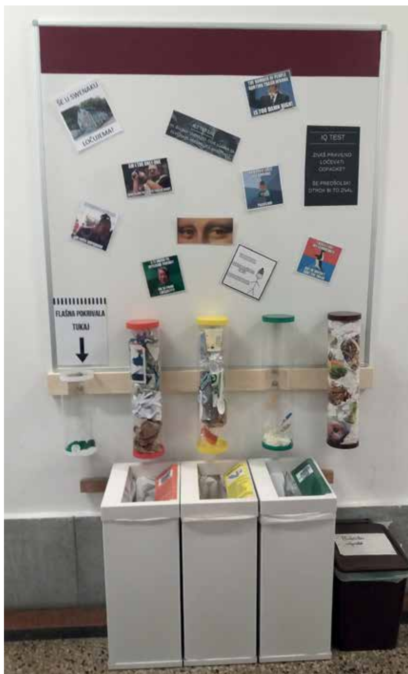
Slika 3: Končna oblika ekološkega otoka

Pri izvedbi ideje so morali pokazati veliko mero iznajdljivosti. Najprej so sestavili motivacijsko pismo za morebitne sponzorje projekta. Šola namreč ni imela potrebnih sredstev, zato so jim morali pridobiti sami. Obrnili so se na lokalna podjetja, ki so njihov projekt podprla finančno ali v obliki storitev. Pri izdelavi mehanskih delov za opremo ekoloških otokov so jim pomagali profesorji in dijaki programov Strojnik in Mehatronik-operater, ki delujeta v