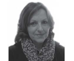
Magdalena Klasinc Gimnazija Jurija Vege Idrija COBISS: 1:04