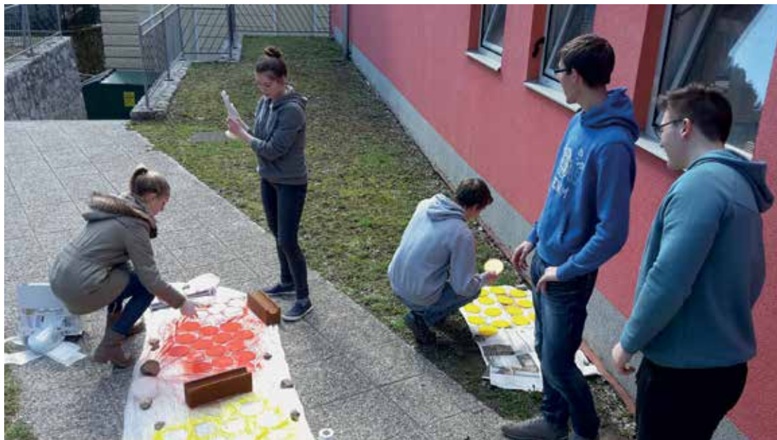
Slika 1: Proces izdelave pokrovčkov za cevi.

metodami smo pokrili tudi splošne značilnosti projektne dela, ki so: