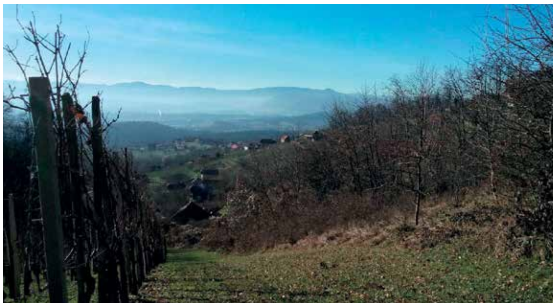
Slika 1: Trška gora

Oni dan sem na lokalni internetni strani brala energičen prepir o zapisu imena grička, na katerem je svojo posest že leta 1136 dobil stiški cistercijanski samostan, na vrhu 428 visokega vinorodnega grička pa od leta 1623 stoji