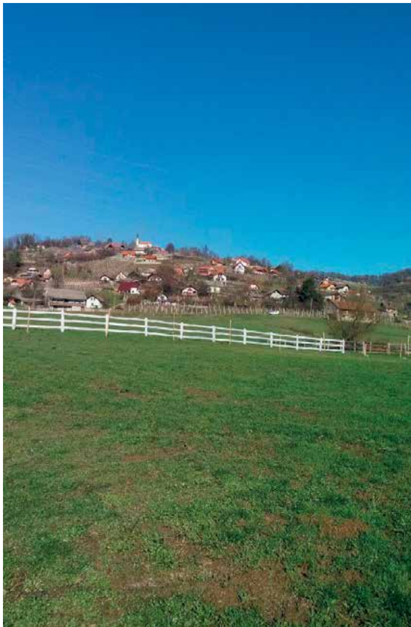
Slika 3: Trška gora malo drugače

V geografiji se pojavljajo delitve treh celin: Evrope, Afrike in Azije (npr. Južna Evropa, Severna Evropa, Srednja/Centralna Afrika, Vzhodna Azija ...), ne pa Amerike in Avstralije. Gre za poimenovanja regij, ki se pojavljajo kot zemljepisna imena in so posledica členitve posameznih celin na geografsko zaokrožene enote z natančno določenim pripadajočim ozemljem in obsegom. Na prvi pogled je vse enostavno, v praksi pa malo manj. Politično