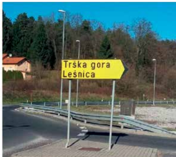
Slika 2: Trška Gora ali Trška gora?