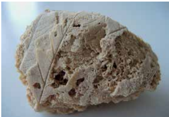
Slika 4: Lehnjak