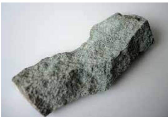
Slika 5: Tuf