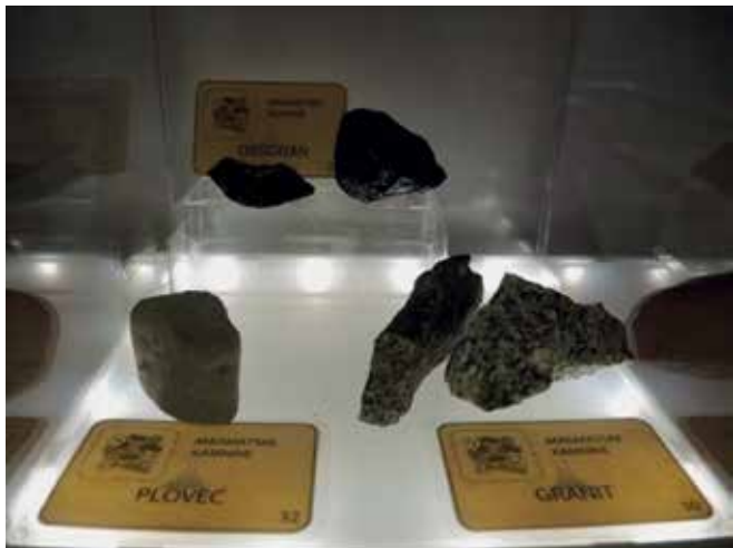
Slika 2: Del zbirke magmatskih kamnin z identifikacijskimi karticami

Vsak kamen v zbirki ima tako tudi svojo identifikacijsko kartico, na kateri so označene njegove značilnosti, ime in zaporedna številka (Slika 2).