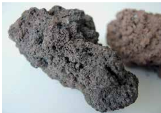
Slika 8: Bazaltni lavi

ima vsaka kamnina glede na okolje nastanka svojo globočnino, predornino in žilnino z enako kemično zgradbo. Magmatske kamnine nastanejo s strjevanjem oziroma kristalizacijo magme, vroče taline staljenih kamnin v Zemljini notranjosti. Magma lahko kristalizira pod površino v Zemljini skorji ali pa prodre na površje, kjer jo imenujemo lava. O globočninah govorimo, če se magma ohladi in pride do kristalizacije mineralov v Zemljini skorji. Ko magma prodre na površje v obliki lave, nastanejo predornine (vulkanske ali ekstruzivne magmatske kamnine). Žilnine nastanejo, ko magma v Zemljini skorji kristali po razpokah in žilah, kjer zapolni prazne prostore (Rožič Žvab, 2016).