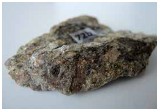
Slika 9: Blestnik, opremljen z identifikacijsko številko

metamorfne kamnine . V zbirki imamo tri primere skrilavih kamnin (filitoidni skrilavec, blestnik in gnajs). V primeru ko so pritiski približno enaki v vseh smereh, minerali pa niso podolgovatih ali lističastih oblik, se ti ne usmerijo in skrilavost se ne pojavi. Takim kamninam pravimo masivne metamorfne kamnine (Jeršek, 2017; Rožič Žvab, 2016). V zbirki so zastopani eklogit, serpentinit in marmor. Slednji nastane z metamorfozo apnenca ali dolomita, je bele do črne barve, kristali so lahko veliki ali majhni. Od minerala je odvisno, ali bo reagiral na 10 % HCl ali ne. V Sloveniji so nahajališča marmorja na pobočjih Pohorja, znan pa je tudi opuščen rimski kamnolom v dolini Slovenske Bistrice. Velikokrat se ime marmor uporablja v marketinške namene, saj ga podjetja uporabljajo za vse obdelane kamnine, ki s samim marmorjem nimajo nobene povezave.