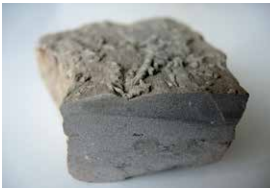
Slika 3: Peščenjak