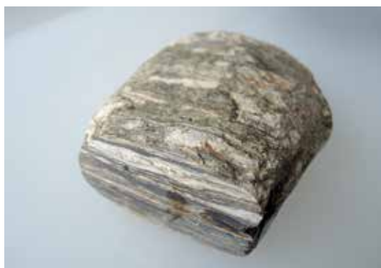
Slika 10: Gnajs nastane z metamorfozo granita.