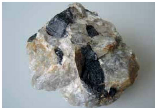
Slika 6: Pegmatit