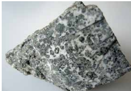
Slika 7: Čizlakit