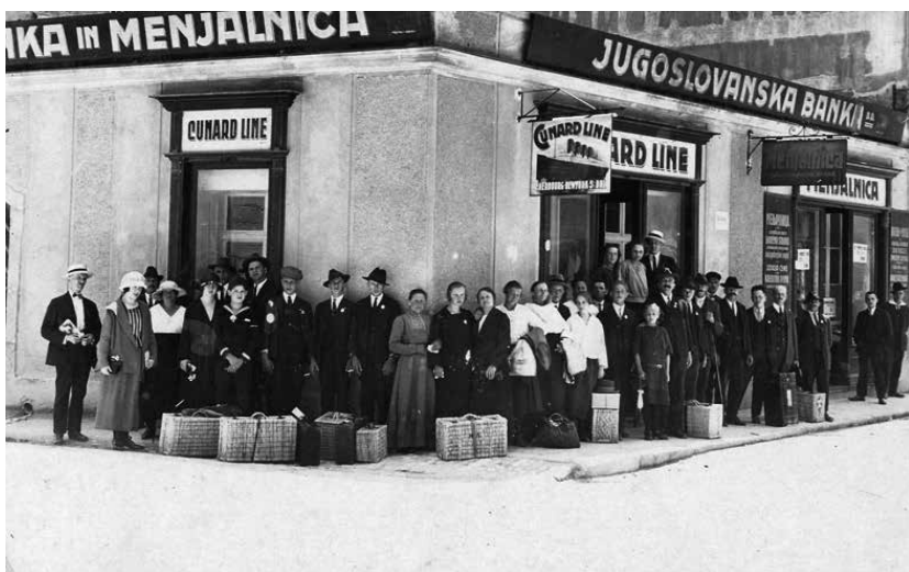
Slika 3: Skupina slovenskih izseljencev pred zastopništvom družbe Cunard Line v Ljubljani (po letu 1918)

Učenci in dijaki morajo poznati nekaj ključnih pojmov, ki se navezujejo na področje migracij in slovenskega izseljenstva, saj bodo le tako zmožni celostno razumeti področje slovenskega izseljenstva in sodobnih migracijskih procesov.