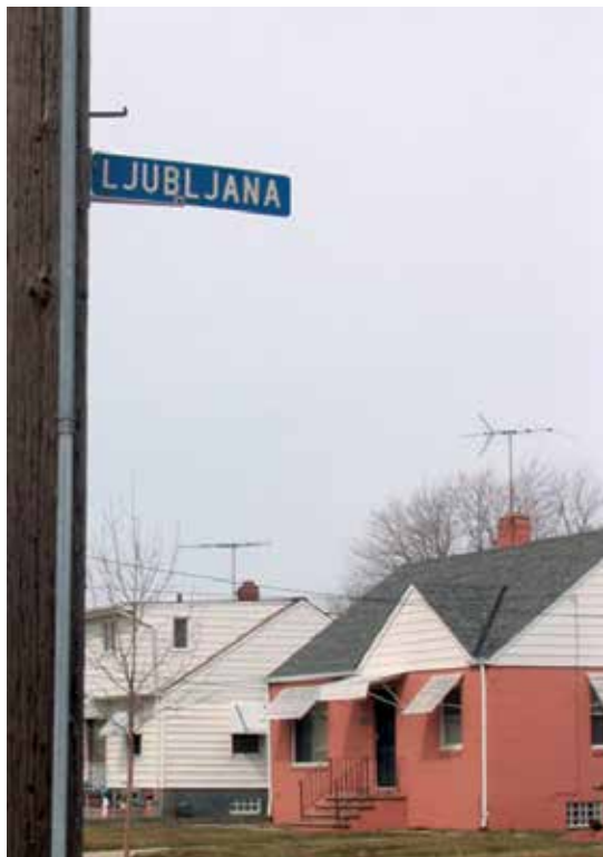
Slika 2: Ulica Ljubljana v predmestju Clevelanda, Euclid, ZDA