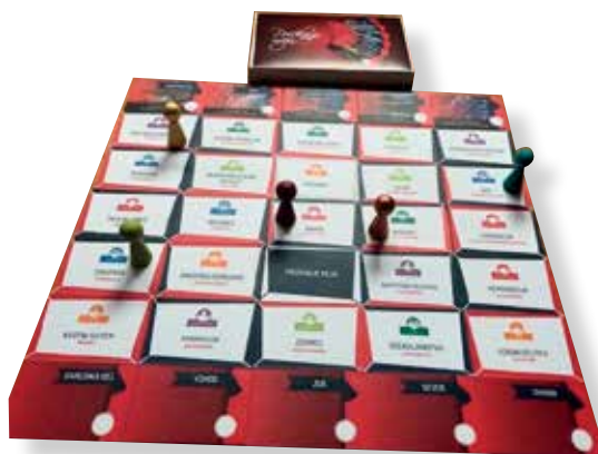
Slika 5: Didaktična in namizna igra prečkanje meja