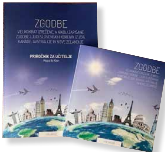
Slika 4: Knjiga in priročnik za učitelje Zgodbe – velikokrat izrečene, a nikoli zapisane zgodbe ljudi s slovenskimi koreninami iz ZDA, Kanade, Avstralije in Nove Zelandije

Učila so trenutno na voljo pri avtorici članka.